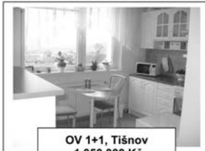
OV 1+1, Tišnov 1.050.000 Kč

pro naše klienty hledáme byty, domy a pozemky v Tišnově a okolí, pro prodávající veškeré služby zdarma!