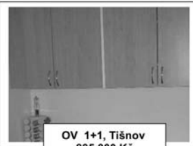
OV 1+1, Tišnov 835.000 Kč

tel./fax: 549 410 410, 731 178 692, www.reality-tisnov.cz , e-mail: info@reality-tisnov.cz