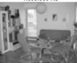
Byt 3+kk v OV Tišnov, ul.Dlouhá, 65 m 2 , 1.NP, terasa. 1.740.000 Kč