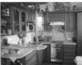
Byt 3+kk v OV s terasou, Tišnov Dlouhá, 74,5 m 2 , novostavba 1.750.000 Kč