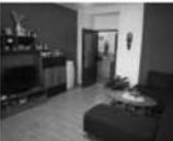
Byt 3+1, Lomnice, Družstevní v OV, s garáží, 2.NP, 69 m 2 , balkon 1.699.000 Kč