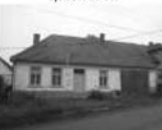
RD 3+1, Křížáň, CP 1052 m 2 , podsklepený, zahrada, dvůr. 1.350.000 Kč