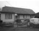
RD 3+1, Horní Loučky, CP 323 m 2 , přízemní, nepodsklepený, zděná stodola. 890.000 Kč