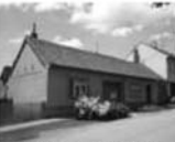
RD 5+2 Lažánky, CP 399 m 2 , výťah, CP 75 m 2 , vytápění plyn. kotlem, orientace jih. 1.600.000 Kč