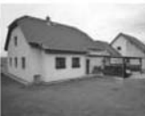
Novostavba RD 2+kk + 3+kk, Sentice, CP 1007 m 2 , ZP 133 m 2 4.950.000 Kč