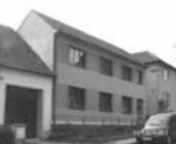
RD 6+2 Rohozec, CP 716 m 2 , garáž, zahrada, hosp. přístavba. Cena k jednání 2,8 mil.