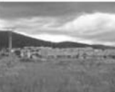
Prodej pozemku, Tišnov, CP 829 m 2 , lokalita Hony za Kuk. 790 Kč/m 2