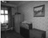
Byt 1+1 v OV, Lomnice, 1.NP, 44 m 2 , cihla, garáž a zahrádka ve dvoře. Cena: 499.000 Kč