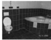
RD 5+1 Hradčany, 1945 m 2 , vl. studna, z části zrekonstruovaný, jižní svah. 1.999.000 Kč