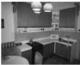
Pronájem bytu 3+1, Předklášteří, 96 m 2 Cena bez inkasa: 7.500 Kč