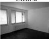
DB 1+1, Vevrská Bitýšky, 1.NP, 35 m 2 , cihla, před rekonstrukcí Cena: 790.000 Kč