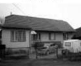
RD 3+1, Horní Loučky, CP 323 m 2 , přízemní, nepodsklepený, zděná stodola. 999.000 Kč