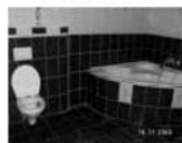
RD 5+1 Hradčany, 1945 m 2 , vl. studna, z části zrekonstruovaný, jižní svah. 1.999.000 Kč