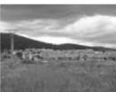
Prodej pozemku, Tišnov, CP 829 m 2 , lokalita Hony za Kuk. 790 Kč/m 2