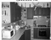
Byt OV 3+1 Tišnov, CP 70 m 2 , po luxus. rekonstrukci, zahrada 1.950.000 Kč