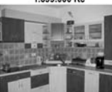
Byt 3+kk v OV Tišnov, ul.Dlouhá, 65 m 2 , 1.NP, terasa. 1.800.000 Kč