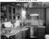
Byt 3+kk v OV s terasou, Tišnov Dlouhá, 74,5 m 2 , novostavba 1.750.000 Kč