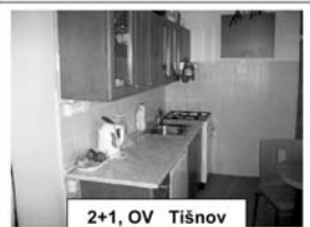
2+1, OV Tišnov 1 350 000.-

pro naše klienty hledáme byty, domy a pozemky v Tišnově a okolí, pro prodávající veškeré služby zdarma!