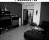
Byt 3+1, Lomnice, Družstevní v OV, s garáží, 2.NP, 69 m 2 , balkon 1.699.000 Kč