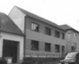
RD 6+2 Rohozec, CP 716 m 2 , garáž, zahrada, hosp. přístavba.Cena k jednání 2,8 mil.