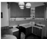
Pronájem bytu 3+1, Předklášteří, 96 m 2 , volné od 1.12. Cena bez inkasa: 8.000 Kč