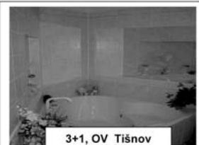
3+1, OV Tišnov 1 720 000.-

tel./fax: 549 410 410, 731 178 692, www.reality-tisnov.cz , e-mail : info@reality-tisnov.cz