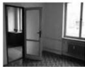
Byt 2+1, Tišnov, Jamborova, CP 52 m 2 , cihla, 2.NP, balkon 1.099.000 Kč