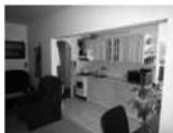
Byt 3+1 v OV Tišnov Květnická, 73 m 2 , po kompletní rekonstrukci 1.799.000 Kč