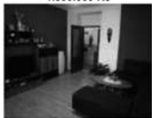
Byt 3+1, Lomnice, Družstevní v OV, s garáží, 2.NP. 69 m 2 , balkon 1.699.000 Kč