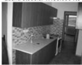
Pronájem bytu 3+1, Tišnov, Mánesova, 5.p. výtah, CP 75 m 2 , 10.000 Kč/měsíc včetně inkasa