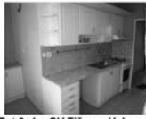
Byt 3+1 v OV, Tišnov, Halasova 75 m 2 , 5. patro, po rekonstrukci 1.699.000 Kč