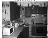
Byt OV 3+1 Tišnov, CP 70 m 2 , po luxus. rekonstrukci, zahrada 2.050.000 Kč