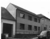
RD 6+2 Rohozec, CP 716 m 2 , garáž, zahrada, hosp. přístavba. Cena k jednání 2,8 mil.