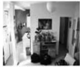
Byt 3+kk v OV, Tišnov, Květnická, 4 p. 83 m 2 , vl. plyn kotel 1.899.000 Kč