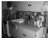
Pronájem 3+1 Tišnov Králova, 1. NP, 10.500,-Kč/měsíc