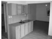
Byt 3+kk Veverská Bítýšská, OV, CP 69 m 2 , 1.NP, 1.230.000 Kč