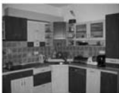
Byt 3+kk v OV Tišnov, ul. Dlouhá, 65 m 2 , 1.NP, terasa. 1.800.000 Kč