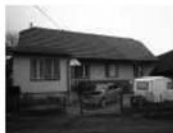
RD 3+1, Horní Loučky, CP 323 m 2 , přízemní, nepodsklepený, zděná stodola. 1.190.000 Kč