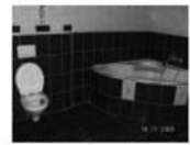
RD 5+1 Hradčany, 1945 m 2 , vl. studna, z části zrekonstruovaný, jižní svah. 1.999.000 Kč

Komenského nám. 124, 666 01 Tišnov, budova Komerční banky, Tišnov, 1. patro Tel. / fax: 549 410 321, mobil: 776 077 842, email: office@komplexnireality.cz