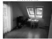
Byt 3+kk, Tišnov, Formáňkova, OV, 3.NP, 69 m 2 , novostavba, nízké měsíční náklady. 2.100.000 Kč