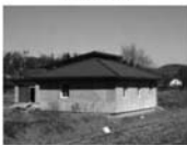
RD 4+kk Březina CP 981 m 2 , dům před dokončením. 2.200.000 Kč