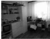
Byt 2+1 v OV Tišnov Květnická, CP 63 m 2 , 3NP/4, po kompl. rekon. 1.499.000 Kč