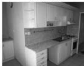
Byt 3+1 v OV, Tišnov, Halasova 75 m 2 , 5.patro, po rekonstrukci 1.749.000 Kč