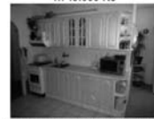
Byt 3+1 v OV Tišnov Květnická, 73 m 2 , po kompletní rekonstrukci 1.900.000 Kč