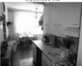
Byt 3+1 v OV, Tišnov, Halasova, CP 63 m 2 , 1.p, lodžie 1.680.000 Kč