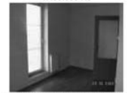
DB 3+kk, Tišnov, Dlouhá, 2.NP, 73 m 2 , balkon, nízké měs. náklady 2.050.000 Kč