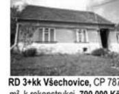
RD 3+kk Všechnovice, CP 787 m 2 , k rekonstrukci, 790.000 Kč

Komenského nám. 124, 666 01 Tišnov, budova Komerční banky, Tišnov, 1. patro Tel. / fax: 549 410 321, mobil: 776 077 842, email: office@komplexnireality.cz