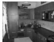
Pronájem bytu 2+kk, Tišnov, Brněnská, 1.NP, po rekonstrukci 9.000 Kč / měsíc včetně inkasa