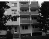
Pronájem bytu 1+1, Tišnov, Králova, 3.p, CP 36 m 2 , volně 6.500 Kč/měsíc včetně inkasa