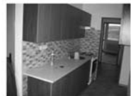
Pronájem bytu 3+1, Tišnov, Mánesova. 5.p. výťah, CP 75 m 2 , 10.000 Kč/měsíc včetně inkasa