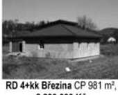
RD 4+kk Březina CP 981 m 2 , 2.200.000 Kč