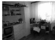
Byt 2+1 v OV Tišnov Květnická, CP 63 m 2 , 3NP/4, po kompl. rekon. 1.490.000 Kč