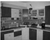
Byt 3+kk v OV Tišnov, ul. Dlouhá, 65 m 2 , 1. patro 1.800.000 Kč