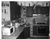
Byt OV 3+1 Tišnov, CP 70 m 2 , po luxus. rekonstrukci, zahrada 2.050.000 Kč