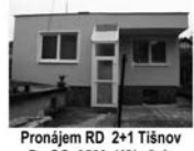
Pronájem RD 2+1 Tišnov Po Go, 9500,-Kč/měsíc