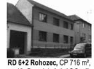
RD 6+2 Rohozec, CP 716 m 2 , garáž, Cena k jednání 2,8 mil.