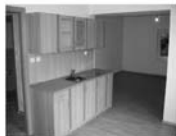
Byt 3+kk Veverská Bitýška, OV, CP 69 m 2 , 1.NP, 1.300.000 Kč