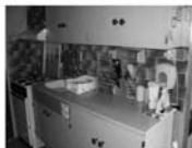
Pronájem 3+1 Tišnov Králova, 1.NP, 10.500,-Kč/měsíc