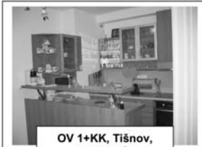
OV 1+KK, Tišnov, novostavba

pro naše klienty hledáme byty, domy a pozemky v Tišnově a okolí, pro prodávající veškeré služby zdarma!