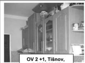
OV 2 +1, Tišnov, 1.400.000 Kč

tel./fax: 549 410 410, 731 178 692, www.reality-tisnov.cz , e-mail: info@reality-tisnov.cz