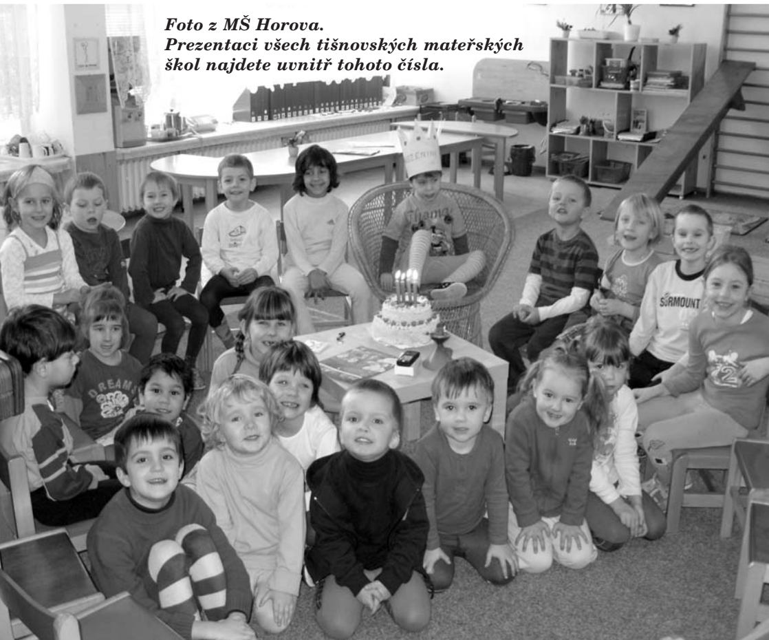
Foto z MŠ Horova. Prezentaci všech tišnovských mateřských škol najdete uvnitř tohoto čísla.