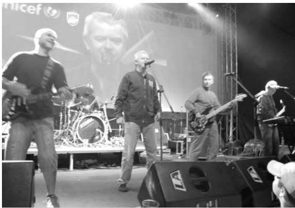
Mňága a Žďorp na festivalu Hudbou pro UNICEF 2009

I v roce 2009 bylo dobrovolné vstupné na domácí zápasy určeno na podporu UNICEF. Výtěžek se však svojí výší ani zdaleka nepřiblížil rokům předchozím a tak je konečná částka pouze 2.800,- Kč. Jako tradičně se k tomuto počínu přidali i samotní hráči a shromáždili mezi sebou částku 6.300,- Kč. Společně s výtěžkem z charitativního hudebního festivalu Hudbou pro UNICEF, který pořádali házenkáři v září loňského roku v areálu