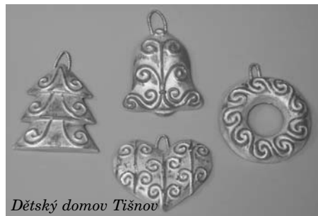
Dětský domov Tišnov