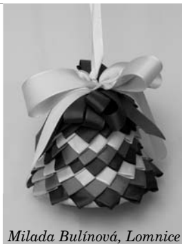
Milada Bulínová, Lomnice

Do soutěže se přihlásilo celkem 36 soutěžících, kteří byli z Tišnova a okolí – Železné, Předklášteří, Lomnice u Tišnova, Brno.