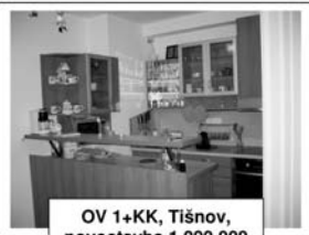
OV 1+KK, Tišnov, novostavba 1.090.000

pro naše klienty hledáme byty, domy a pozemky v Tišnově a okolí, pro prodávající veškeré služby zdarma!