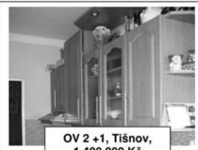
OV 2 +1, Tišnov, 1.400.000 Kč

tel./fax: 549 410 410, 731 178 692, www.reality-tisnov.cz , e-mail: info@reality-tisnov.cz