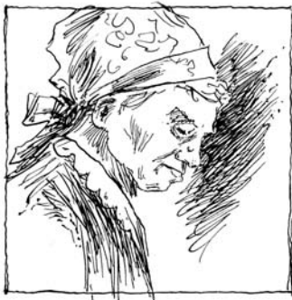
Portrét matky /kresba/

Francii, Chorvatsku, Španělsku přivezl obrazy tamější krajiny. Tvorbou a celým srdcem zůstává věren naší krajině.