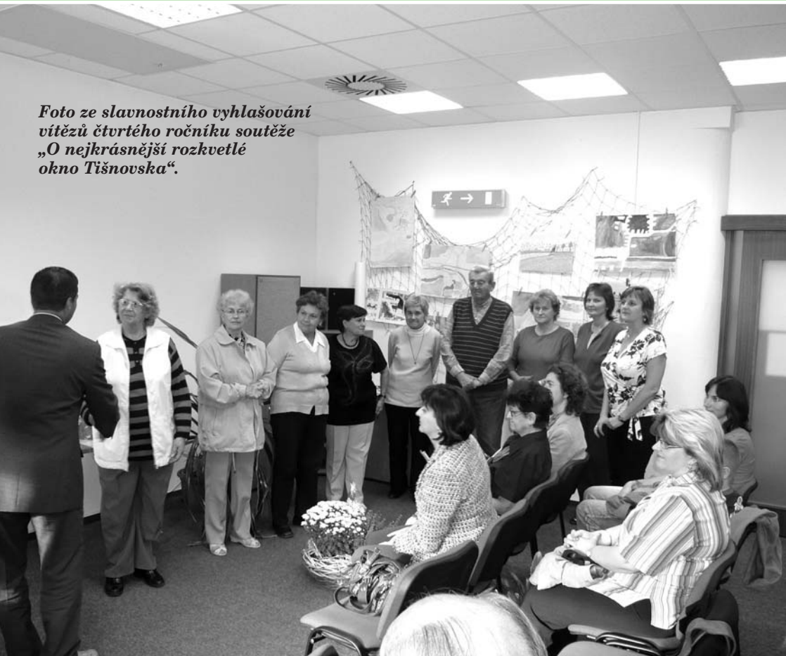
Foto ze slavnostního vyhlášení vítězů čtvrtého ročníku soutěže „O nejkrásnější rozkvetlé okno Tišnovska“.