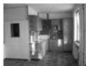
Byt 2+1 OV Tišnov Jamborova CP 52 m 2 , započata rekonstrukce 1.199.000 Kč

Největší nabídka nemovitostí na Tišnovsku.