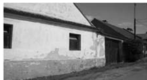
Prodej RD : Jamné

Rodinný dům se stodolou včetně pozemku o výměře cca 500 m 2 . Nutná rekonstrukce.