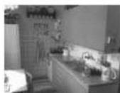
DB 2+1 Tišnov Na rybníčku CP 56,3 m 2 , 4. patro, v ceně garáž 1.599.000 Kč