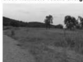
Pozemek ke stavbě RD, Tišnov, Lomnická CP 1441 m 2 2.500 Kč/ m 2