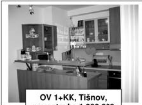
OV 1+KK, Tišnov, novostavba 1.090.000

pro naše klienty hledáme byty, domy a pozemky v Tišnově a okolí, pro prodávající veškeré služby zdarma!