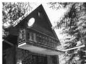
Celoroční obyv.rekr. chata Heroltice, 480 m 2 , studna, el, žumpa 949.000 Kč