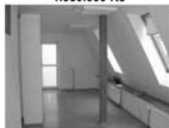
Pronájem kancelář. prostor Tišnov 35 m 2 , kuch.kout, koupelna 8.600 Kč/měsíc včetně inkasa