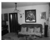
RD 4+1 Tišnov, po celkové nadstandardní rekonstrukci 3.500.000 Kč