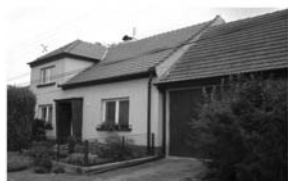
Prodej RD : Deblín

Cena : 1.000.000,- Kč V případě rychlého jednání možnost slevy.