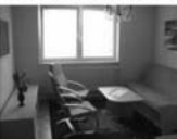
Pronájem bytu 2+1 v RD Tišnov, CP 55 m 2 , volně od 1.9.2009 9.500 Kč/měsíc + energie