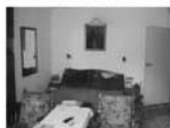
DB 3+1 Tišnov U Humpolky CP 73 m 2 , 3 lodžie, anuita jen 3.000 Kč 1.499.000 Kč