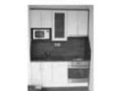
Pronájem luxus. bytu 1+kk Tišnov Brněnská 28 m 2 , terasa 9.000 Kč/měsíc včetně energií