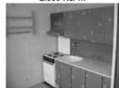
Pronájem bytu 1+1, Tišnov Králova, CP 33 m 2 , 3.patro 6.900 Kč/měsíc včetně inkasa