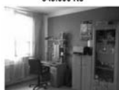
DB 4+1 Tišnov Květnická, 4.p, CP 88m 2 , po rekonstrukci 2.000.000 Kč