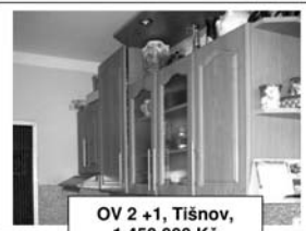
OV 2 +1, Tišnov, 1.450.000 Kč

tel./fax: 549 410 410, 731 178 692, www.reality-tisnov.cz , e-mail: info@reality-tisnov.cz