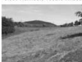
Stavební pozemek, Hradčany, CP 1500 m 2 , IS v dosahu 1.000 Kč / m 2