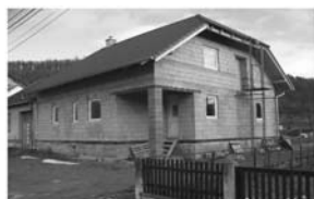
Prodej rozestavěného RD :

Prodej rozestavěného rodinného domu v obci Lomnička s pozemkem 1.000 m 2 .