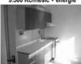
Byt 2+1 Tišnov U Humpolky, 56 m 2 , 1. patro, 2 lodžie, nové stup. 1.115.000 Kč