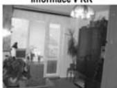
Byt 2+1 Tišnov Horova, CP 55 m 2 , 1. NP, balkon, plast. okna 1.350.000 Kč