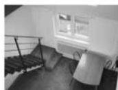
DB 4+1 Tišnov Jamborova CP 89 m 2 , lodžie, v ceně garáž 2.199.000 Kč