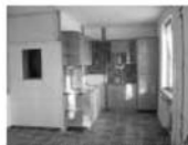
Byt 2+1 OV Tišnov Jamborova CP 52 m 2 , započata rekonstrukce 1.250.000 Kč

Největší nabídka nemovitostí na Tišnovsku.