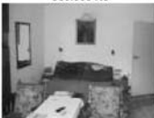
DB 3+1 Tišnov U Humpolky CP 73 m 2 , 3 lodžie, anuita jen 3.000 Kč 1.599.000 Kč