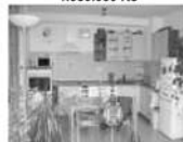
Mezonetový byt 3+kk OV Kuřim Dlouhá CP 58 m 2 , 3. patro 2.450.000 Kč