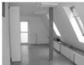
Pronájem kancelář. prostor Tišnov 35 m 2 , kuch.kout, koupelna 8.600 Kč/měsíc včetně inkasa