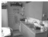
DB 2+1 Tišnov Na rybníčku CP 56,3 m 2 , 4. patro, v ceně garáž 1.599.000 Kč