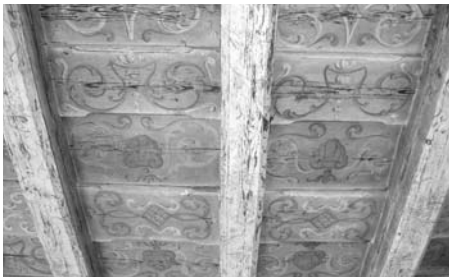
Ornamentální výzdoba trámových stropů

Do ní se pustilo město Tišnov na jaře roku 2009. Předcházely tomu ovšem dva roky přípravy, kdy se zařizovala dotace Finančního mechanismu EHP. Smlouva o poskytnutí 308 096 euro byla podepsána v srpnu 2008 a mohlo se začít.