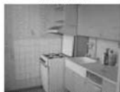
Prodej bytu 1+1 Adamov Sadová, CP 31,4 m 2 , 2x lodžie 950.000 Kč