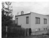
Prodej RD 4+2 Cebín CP 438 m 2 zahrad, garáž, sklep, posezení 2.900.000 Kč