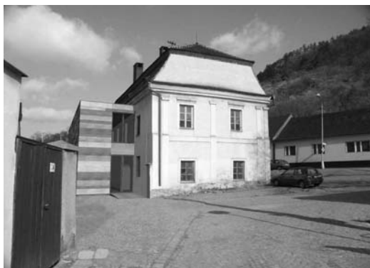
Budoucí podoba Müllerova domu s přístavbou