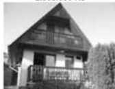
Zděná rekr. chata Heroltice CP 642 m 2 , JS, zahrada, sklep, výhled 1.499.000 Kč