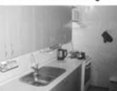
Byt 2+1 OV Tišnov Jamborova, přízemí, CP 56 m 2 , po rekon. 1.550.000 Kč