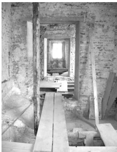
Průhled interiérem v prvním patře