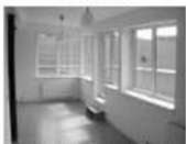
Pronájem luxus. bytu 1+kk Tišnov Brněnská 38 m 2 , terasa 10.000 Kč/měsíc včetně inkasa