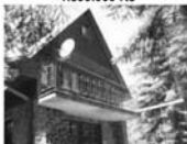
Celoroční obyvj. rekr. chata Heroltice, 480 m 2 , studna, el, žumpa 949.000 Kč