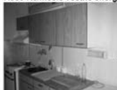
Byt 2+1 OV Tišnov Králova 2.NP, CP 63 m 2 , lodžie, šatna 1.350.000 Kč