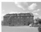
Byt 2+1 OV Tišnov SV, Čecha CP 59,3 m 2 , 2.NP, vl. plyn, kotel 1.250.000 Kč