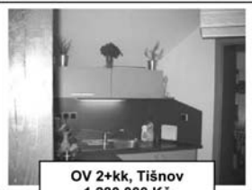
OV 2+kk, Tišnov 1.280.000 Kč

pro naše klienty hledáme byty, domy a pozemky v Tišnově a okolí, pro prodávající veškeré služby zdarma!