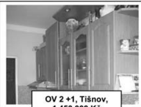
OV 2 +1, Tišnov, 1.450.000 Kč

tel./fax: 549 410 410, 731 178 692, www.reality-tisnov.cz , e-mail: info@reality-tisnov.cz