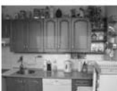
Byt 3+1 OV Tišnov Dlouhá CP 87 m 2 , novostavba, balkon 8m 2 2.190.000 Kč