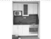
Pronájem luxus. bytu 1+kk Tišnov Brněnská 28 m 2 , výhled 9.000 Kč/měsíc včetně energií