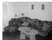
Pronájem bytu 2+1 Předklášteří Uhrova, 55 m 2 , přízemí, plyn, kotel 7.900 Kč/měsíc včetně energií