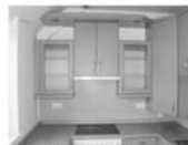
DB 4+1 Tišnov Jamborova CP 89 m 2 , lodžie, v ceně garáž 2.199.000 Kč