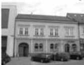
Pronájem komer. prostor Tišnov, Komen. Nám. 40 m 2 , 1. patro 4.500 Kč/měsíc + energie