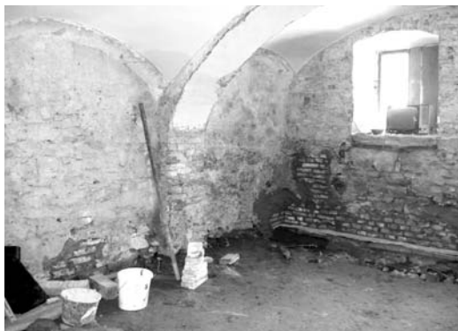
Současný stav interiéru v přízemí