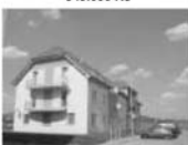
Novostavba bytu 2+kk Tišnov Dlouhá, 73 m 2 , 2.NP, balkon 8 m 2 2.149.000 Kč