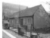
RD 2+1 Borač CP 363 m 2 zahradka, ústř. vytápění, dobrý stav 1.330.000 Kč