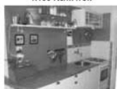
DB 3+1 Tišnov Květnická 73 m 2 4.NP, balkon, výhled na město 1.790.000 Kč