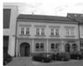
Pronájem obch. prostor / kanceláře, Tišnov, 40 m 2 , 2. NP 4.500 Kč/měsíc + energie