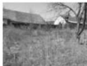
St. pozemek Vohančice, CP 1239 m 2 , stodola, jižní svah 1.100.000 Kč