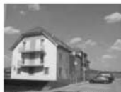
Byt 3+kk OV novostavba Tišnov Formánkova, 73 m 2 , balkon 2.199.000 Kč