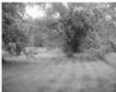
St. Pozemek Štěpánovice CP 815 m 2 , IS na hranici 640 000 Kč