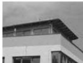
Pronájem luxusního bytu 1+kk Tišnov, CP 38 m 2 , terasa 10.000 Kč/měsíc včetně energií