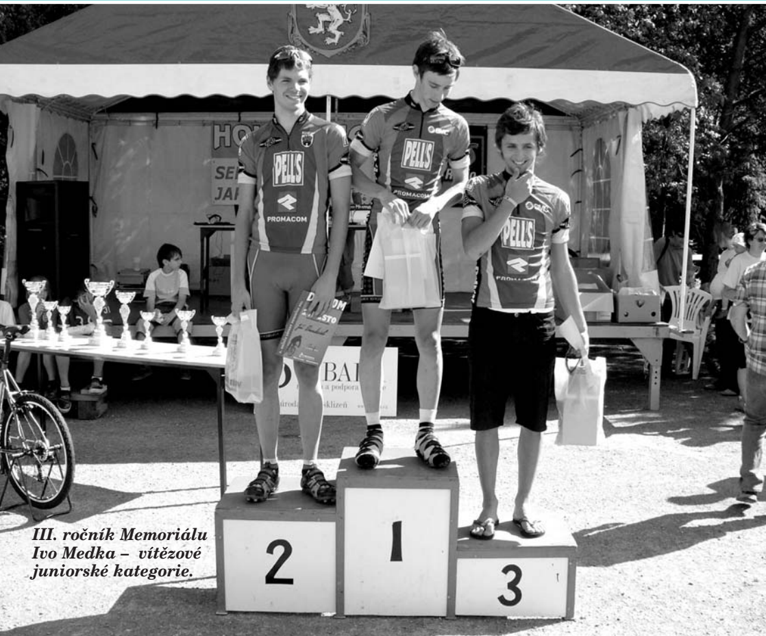
III. ročník Memoriálu Ivo Medka – vítězové juniorské kategorie.