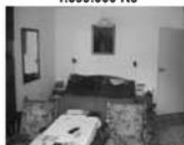
DB 3+1 Tišnov U Humpolky 1. NP, CP 73 m 2 , ložnice, výtah 1.599.000 Kč