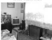
Byt OV 2+1 Kuřim CP 64 m 2 , 1.NP cihla, balkon, v břemeno 1.299.000 Kč