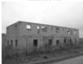
Prodej komerčního objektu Hradčany, HS, podsklepeno 7.000.000 Kč