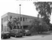
Pronájem kanceláře Tišnov Mrstíkova, 26,25 m 2 , 2.NP 1.100 Kč/m 2 /rok