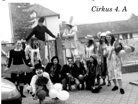
Cirkus 4. A