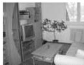
Byt 4+1 OV Tišnov Jamborova cihla, 83 m 2 , balkon, dům po revit. 2.190.000 Kč