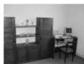
Pronájem bytu 2+1 Tišnov ve zvyš. přízemí RD, CP 65 m 2 7.500 Kč/měsíc včetně inkasa