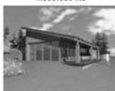
Prodej 2 st. pozemků Lomnička 1800 m 2 , jižní svah, výhled 1890 Kč / m 2