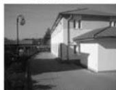
Pronájem 6 kanceláří Tišnov, 20 parkovacích míst, vjezd i pro TIR 1.400 Kč/m 2 /rok