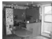
DB 3+kk Tišnov Dlouhá CP 73 m 2 , novostavba, nízké náklady 2.050.000 Kč

Komenského nám. 124, 666 01 Tišnov, budova Komerční banky, Tišnov, 1.patro Tel. / fax: 549 410 321, mobil: 776 077 842, email: office@komplexnireality.cz