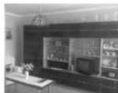
DB 2+1 Tišnov Na Rybníčku CP 56,3 m 2 , 4. patro, cihla 1.599.000 Kč

Největší nabídka nemovitostí na Tišnovsku.