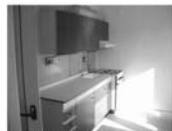
DB 2+1 Tišnov U Humpolky 56 m 2 , 1. patro, výtah, 2 ložnice 1.299.000 Kč