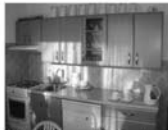
DB 2+1 Tišnov U Humpolky po celkové rekonstrukci 1.599.000 Kč