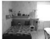
DB 2+kk Tišnov Dlouhá, přízemí, CP 40,8 m 2 , novostavba 1.000.000 Kč