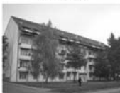
Pronájem bytu 2+1 Tišnov Jamborova, 56 m 2 , po rekonstrukci 9.000 Kč / měsíc včetně energií