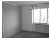
Byt 2+1 OV Tišnov Jiráskova CP 63 m 2 , 2.NP, vl. plyn, kotel 1.650.000 Kč