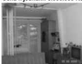
Byt 2+1 OV Tišnov Jamborova 2.NP, CP 57 m 2 , cihla, po rekon. 1.490.000 Kč