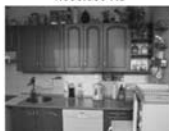
Byt 3+kk OV Tišnov Dlouhá 3.NP, CP 87 m 2 , balkon 8 m 2 2.550.000 Kč