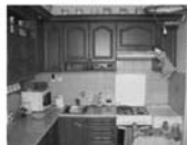
DB 1+1 Tišnov Máněsova CP 30 m 2 , 2.NP, 2 lodžie, po rekon. 1.100.000 Kč