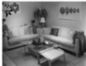
Byt 3+1 OV Tišnov Osvobození CP 74 m 2 , balkon, po rekon. 1.999.000 Kč