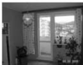
DB 3+1 Kufim Na Loučkách 6.NP, výťah, CP 72 m 2 , lodžie 1.699.000 Kč