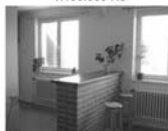
Byt 4+1 OV Tišnov Jamborova 5.NP, CP 83 m 2 , cihla, sam.p.kotel 2.290.000 Kč