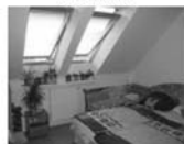
DB 3+kk Tišnov Dlouhá CP 73 m 2 , novostavba, nízké náklady 2.050.000 Kč