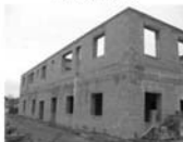
Prodej komerčního objektu Hradčany, HS, podsklepeno Cena k jednání: 8.000.000 Kč