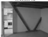
Pronájem mezonetového bytu 1+1 Deblín, 1. NP, volně ihned 5.200 Kč / měsíc + energie