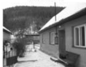
Prodej RD 2+1 Boráč, ústřední topení, zahrádka, kůlna 1.380.000 Kč