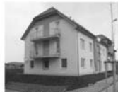
Byt 3+kk OV Tišnov Formánkova, 73 m 2 , balkon 2.199.000 Kč

Největší nabídka nemovitostí na Tišnovsku.