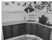
DB 1+1 Tišnov Králůva CP 35 m 2 , 1. NP, lodžie, nová KL 999.000 Kč