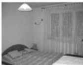
Byt 2+1 OV Tišnov Sv. Čecha 2.NP, cihla, po rekonstrukci 1.750.000 Kč