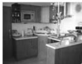
DB 2+kk Tišnov Dlouhá 3.NP novostavba, CP 51,9 m 2 , balkon 1.600.000 Kč