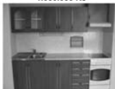
Pronájem bytu 1+1 Tišnov K Cimperku, přízemí, volně ihned 8.000 Kč / měsíc včetně energií