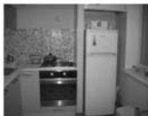
Byt 1+1 OV Tišnov Jamborova 35 m 2 , cihla, po rekonstrukci 1.200.000 Kč