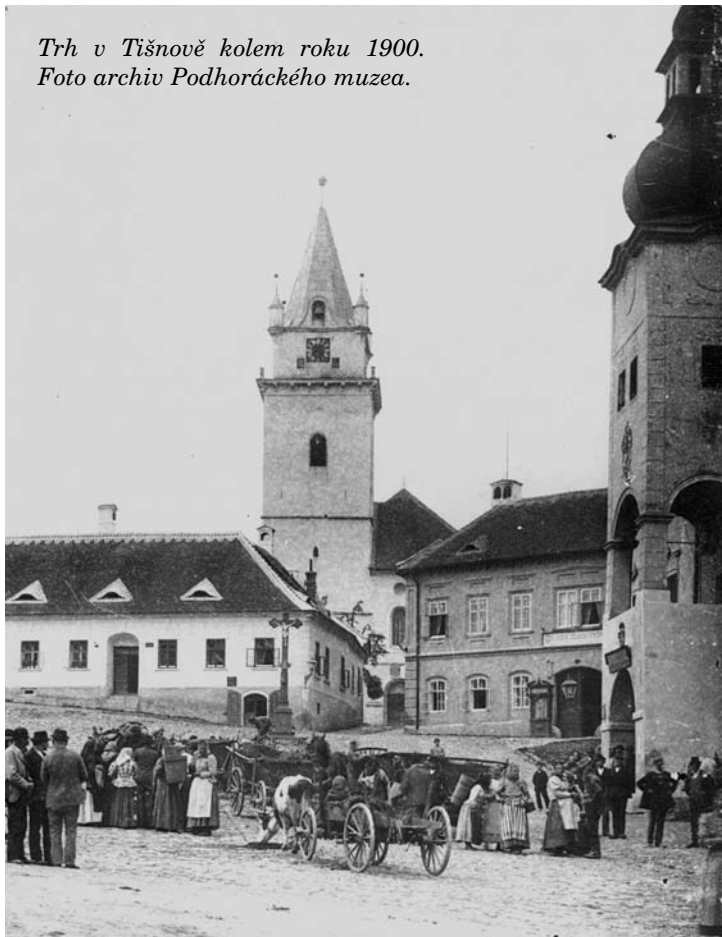
Trh v Tišnově kolem roku 1900.

V šedesátých letech, kdy Tišnov už nebyl okresním městem, začaly v souvislosti se slavením Dne horníků mimořádné prodejní akce. S původními trhy regionálního rozsahu měly pramálo společného. Prodávalo se zde především nedostatkové zboží, prodejci byli z běžných výrobních státních podniků. Forma byla snad neobvyklá, ale hlavně obsah, způsob prodeje a komunikace se zákazníky se nelišily od