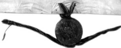
Privilegium českého krále Václava I. ze 7. prosince 1240, poprvé jmenující Tišnov jako městskou osadu s právem trhu (srov. detail textu v horním výřezu).

S datem 1259 tak uvedli zmínku o Tišnově coby městě jak Václav Oharek ve své vlastivědě tišnovského okresu