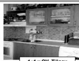
1+1 v OV, Tišnov 1.130.000,- Kč

tel./fax: 549 410 410, 731 178 692, www.reality-tisnov.cz , e-mail: info@reality-tisnov.cz