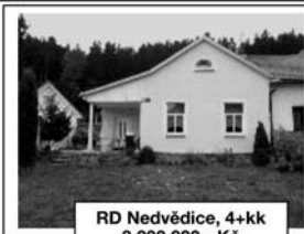
RD Nedvědice, 4+kk 3.200.000,- Kč

pro naše klienty hledáme byty, domy a pozemky v Tišnově a okolí, pro prodávající veškeré služby zdarma!