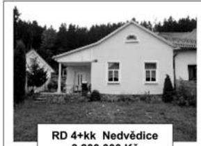
RD 4+kk Nedvědice 3.200.000 Kč

pro naše klienty hledáme byty, domy a pozemky v Tišnově a okolí, pro prodávající veškeré služby zdarma!