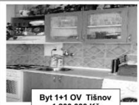
Byt 1+1 OV Tišnov 1.200.000 Kč

tel./fax: 549 410 410, 731 178 692, www.reality-tisnov.cz , e-mail : info@reality-tisnov.cz