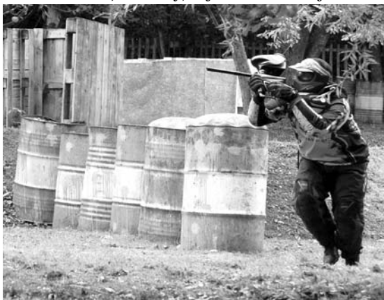
Týmové sehra- nosti brněnských Toxic bylo těžké vzd- rovat, ale i oni byli porazitelní

Vítězové prvních dvou ročníků Palladins se letos bohužel opět nezúčastnili. Snad se jim to podaří na příštím ročníku, neboť by se určitě jednalo o zajímavé klání Palladins