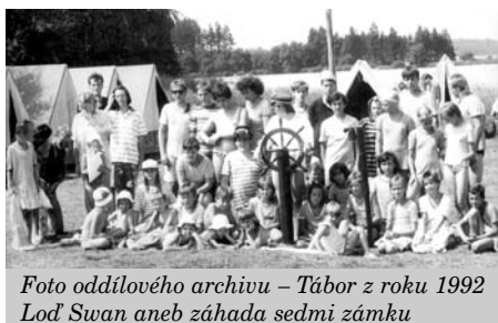
Tábor z roku 1992 Loď Swan aneb záhada sedmi zámku

V tišnovské knihovně probíhá výstava o činnosti tišnovských brďat, spousta fotek, známých i neznámých předmětů – mapy zemí, jiných světů, stroj času či měřič vody z planety Arrakis. Jakých bylo těch dvacet let? Plných her, výletů, poznávání přírody a nových kamarádů, dobrodružných zážitků, táborů. Také to bylo o přátel-