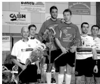
ZŠ Tišnov, nám. 28. října

2. místem si zajistili vedoucí pozici ve Světovém poháru. 4. kolo SP se uskutečnilo během měsíce září v německém Múchelnu.