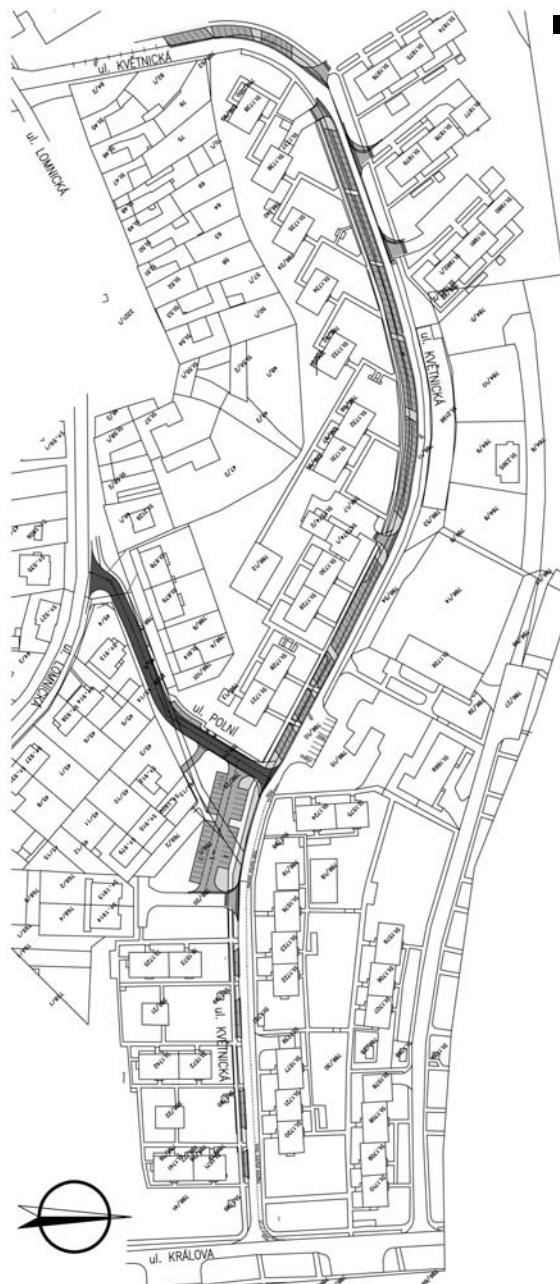
TIŠNOV – UL. KVĚTNICKÁ A POLNÍ ROZŠÍŘENÍ PARKOVACÍCH PLOCH SITUACE 1:2000