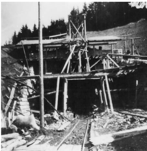
Západní ústí do tunelu u Dolních Louček – 1939

Výtahová věž, postavená v údolí Libochůvky, sloužila pro dopravu materiálu budoucí mostní konstrukce. Tento viadukt se stal největším stavebním objektem na nové trati z Brna do Havlíčkova Brodu. Druhá světová válka ovlivnila pokračování stavby a tunely postavené mezi Tišnovem a Nihovem