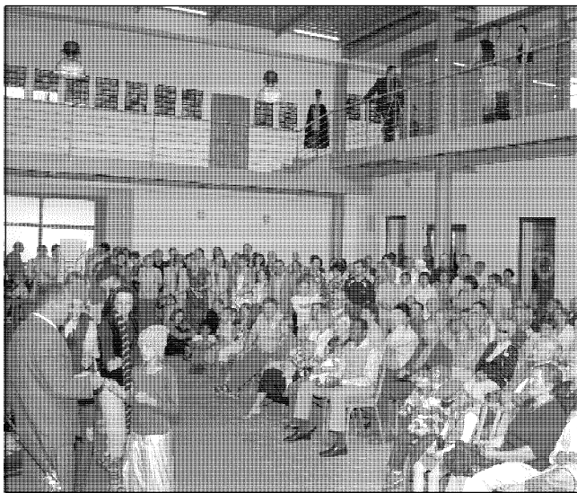
Galerie Diana - z vernisáže výstavy "Tisíc pohledů na Tišnov".