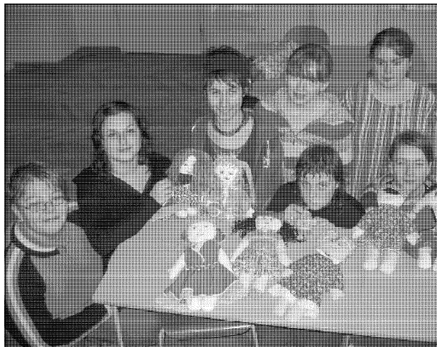
Ochotné malé švadlenky na ZŠ Smíškova