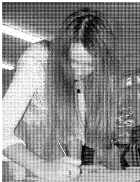
Tak se podepisuje nevěsta...