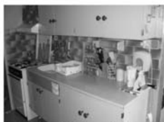
Pronájem 3+1 Tišnov, ul. Králova, CP 73 m 2 , zrevitalizovaná budova, 10.000,- Kč včetně inkasa