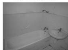
Pronájem 4+kk Tišnov centrum, ul. Jungmannova, CP 97 m 2 I, 2/3, 10.000,- Kč včetně inkasa