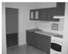
Pronájem 1+1 Tišnov, Hony CP 47 m 2 , 1/4 8.000,-Kč včetně inkasa