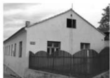
RD 6+2 Lomnice u Tišnova, 2x 3+1 se samost. vchody, 1.100.000,- Kč