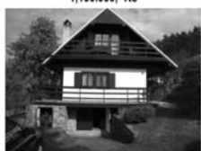
Chata 3+kk Lomnička u Tišnova, CP 415 m 2 , nízké měsíční náklady, 1.500.000,- Kč