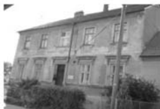
Prodej bytového domu Předklášteří, CP 1336 m 2 , 5.000.000,- Kč