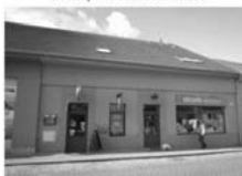
Pronájem obchodu Tišnov, včetně soc. zázemí a kanceláře, 110 m 2 23.000,- Kč + inkaso