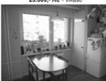
OV 3+1 Tišnov, CP 73 m 2 , 7/8, pěkný byt u lesa 1.499.000,- Kč