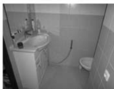
OV 1+1 Tišnov, ul. Květnická, nová koupelna, CP 33 m 2 , 950.000,- Kč