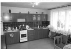
RD 5+kk Chudčice, CP 1007 m 2 , klidná lokalita 2.999.000,- Kč