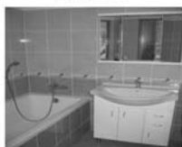
Pronájem 3+1 Tišnov, ul. Mánesova, po celkové rekonstrukci, CP 74 m 2 , 5/8 10.500,- Kč včetně inkasa