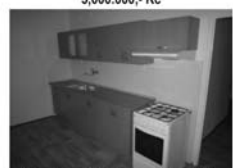
Pronájem 3+1 Tišnov, ul. Hornická CP 78 m 2 , nová koupelna i kuchyně, 10.000,- Kč včetně inkasa