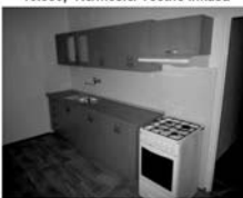
Pronájem 3+1 Tišnov, ul. Hornická, 1. patro, CP 73 m 2 , 11.000,- Kč / měsíc / včetně inkasa