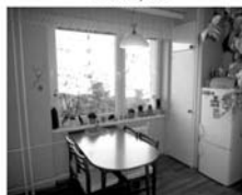
OV 3+1 Tišnov, CP 73 m 2 , 7/8, pěkný byt u lesa 1.550.000,- Kč