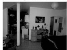
Byt OV 3+kk Tišnov, ul. Květnická CP 83 m 2 , 5/5, vlast. plyn. topení 1.699.000 Kč