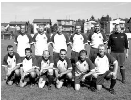
Zástupci města se zúčastnili fotbalového turnaje partnerských měst v polském Sulejówě

Evropa pro občany, který má za úkol podporovat budování sítě partnerských měst a vzájemné spolupráce a setkávání občanů jednotlivých měst. Součástí programu byl také fotbalový turnaj partnerských měst, ve kterém zástupci našeho města posílili několika hráči 1. FC Květnice obsadili 3. místo.