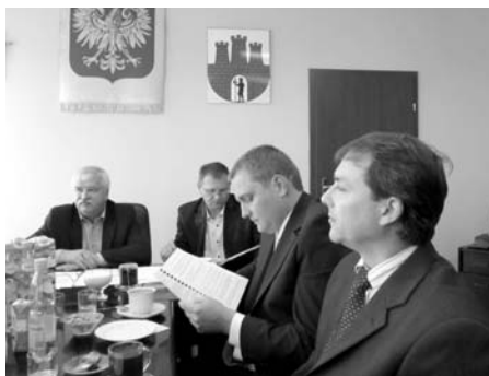
Foto z jednání o účasti na společném projektu EU na radnici