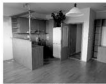
DB 3+kk Tišnov, Dlouhá CP 72 m 2 , 2/4 1.990.000,- Kč