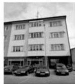
Pronájem 4+kk Tišnov centrum, ul. Jungmannova, CP 97 m 2 1, 2/3, 11.000,- Kč / měsíc / včetně inkasa