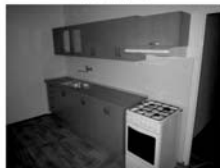
Pronájem 3+1 Tišnov, ul. Hornická Nová koupelna i kuchyně, CP 78 m 2 , 2/3 11.000,- Kč včetně inkasa