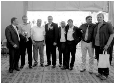
Foto ze setkání se zástupci města Sulejów v rámci okresních dožíněk

terciáckého opatství v Sulejówě-Podklasźtorze. Během návštěvy došlo také k třístrannému jednání mezi zástupci polského Sulejówá, maďarského města Heves a Tišnova, jehož závěrem byla předběžná dohoda na účasti ve společném projektu spolupráce tří měst v rámci programu Evropské unie