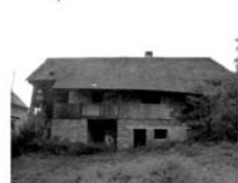
RD 3+kk Vratislávka, k rekonstrukci, 150 m 2 150.000,- Kč