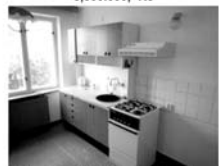
Pronájem 3+1 Tišnov, Klucanina, CP 74 m 2 , 2. patro 10.350,- Kč/měsíc/ včetně inkasa