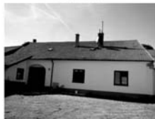
RD 5+kk Lomnice u Tišnova, CP 504 m 2 , po kompletní lux rekonstrukci 3.500.000,- Kč