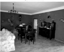
RD 5+kk Lomnice u Tišnova, Po komp. rekonstrukci, pozemek 504 m 2 . 3.500.000,- Kč