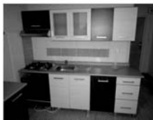
OV 1+1 Tišnov, ul. Květnická CP 34 m 2 , nová KL, nová koupelna, 980.000 Kč