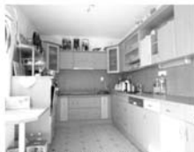
DB 4+kk Tišnov s terasou, ul. Dlouhá, cihla, 4/4, CP 97 m 2 , 2.250.000,- Kč