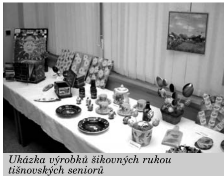
Ukázka výrobků šikovných rukou tišnovských seniorů