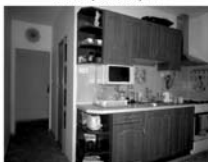
Byt DB 2+1, Tišnov, ul. Květnická, 56,09 m 2 , anuita splacena 1,399.000,- Kč