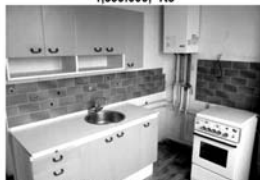
Pronájem 2+1 Tišnov, Hornická, CP 55 m 2 , vlast. plyn. topení, cihla, 8.500,- Kč/měsíc včetně inkasa