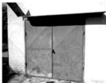
Pronájem zděné garáže Tišnov, ul. Družstevní, CP 20 m 2 , 800,- Kč/měsíc