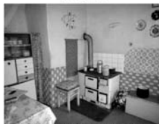
Byt OV 1+1 Lomnice u Tišnova, CP 43,6 m 2 , + dílna, garáž a zahrádka. 375.000,- Kč