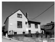
RD 5+kk Předklášteří na rekonstrukci, CP 457 m 2 , klidné místo, 3,499.000,- Kč