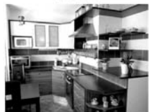
Byt OV 3+1 Tišnov, Květnice, CP 73,84 m 2 , 4/4, po lux.rekonstrukci. 1,950.000,- Kč