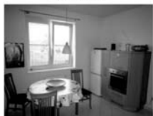
Byt DB 1+1 Tišnov, ul. Dlouhá, novostavba, 1/4, CP 43 m 2 , 980.000,- Kč