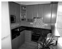
Novostavba DB 3+kk, Dlouhá, Tišnov, CP 71 m 2 , nová KL, vest. spotřebiče, skříně. 1,690.000 Kč