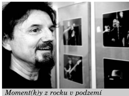
Moment(k)y z rocku v podzemí

(23. 5.) a vernisáž výstavy fotografií Moment(k)y z rocku v podzemí (25. 5.), jejichž autorem je Vladimír Sabo.