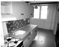
Pronájem 3+1 Tišnov, ul. Králova, přízemí, CP 73 m 2 , 10.000,- Kč / měsíc, včetně inkasa