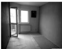
Byt OV 3+kk Tišnov, ul. Brněnská, CP 60 m 2 , novostavba, 1.patro Cena 1,450.000,- Kč