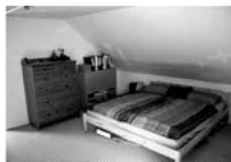
Byt OV 3+kk Tišnov, ul. Květnická CP 83 m 2 , 5/5, novostavba, vlast.plyn.topení 1,699.000 Kč