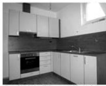
Byt OV 3+kk Tišnov ul. Na Hrádku, CP 57,4 m 2 + balkon 4,1 m 2 , 1.patro 1,838.512,- Kč včetně provize rk