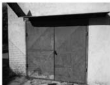
Pronájem zděné Garáže Tišnov, Chodníček Jary Cimermana, CP20 m 2 , 800,- Kč/měsíc