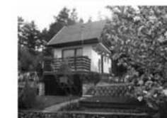
Zděná rekreační chata, Hradčany CP 403 m 2 , po kompletní rekonstrukci. 990.000,- Kč