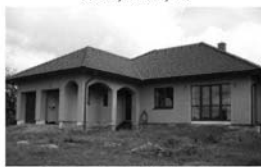
RD 4+kk s dvojaráží, Vratislávka, CP 925 m 2 , novostavba 3,299.000,- Kč