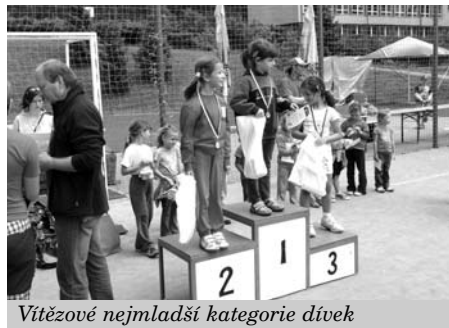
Vítězové nejmladší kategorie dívek