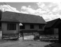
RD 3+1 Horní Loučky, CP 323 m 2 , klidná lokalita, volně ihned. 690.000,- Kč