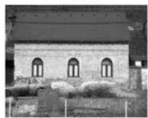
RD 5+1 Tišnov, ul. Trmačov, CP 424 m 2 , podkrovní k dokončení. 1,700.000,- Kč