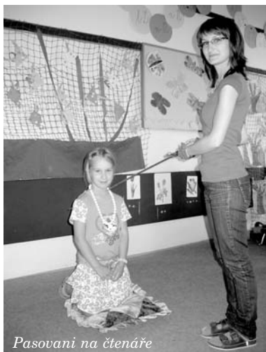
Pasování na čtenáře

V květnu jsme po dlouhých přípravách podali projektovou žádost o zapojení do dalšího celostátního projektu „EU – peníze školám“. Již jsme z Ministerstva školství, mládeže a tělo-