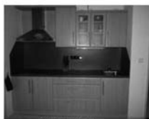
Byt DB 1+1 Tišnov, ul. Dlouhá, novostavba, 1/4, CP 43 m 2 , 980.000,- Kč