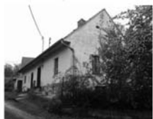
RD 3+1 Zďárec, CP 351 m 2 , dům k rekonstrukci. 400.000,- Kč