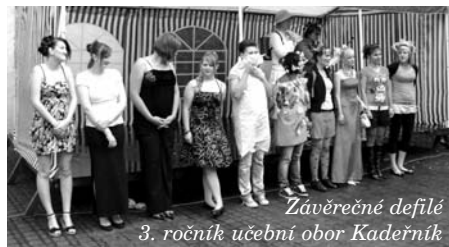
Závěrečné defilé 3. ročník učební obor Kadeřník

Poslední květnový pátek se pak lomnický zámek otevřel široké veřejnosti, konala se tradiční přehlídka odborných dovedností s podtitulem Škola základ života spojená s taneční zábavou. Akci za-