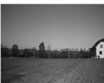
Stavební pozemek Křížinkov CP 1406 m 2 , el., plyn, voda na hranici poz. 350,- Kč / m 2