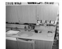
Byt OV 2+1 Tišnov, ul. Jamborova, CP 55 m 2 , nová koupelna, 2.patro Cena 1,199.000,- Kč