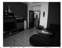
3+1 v OV s balkonem a garáží, Lomnice CP 69 m 2 , po rekonstrukci, cihlový dům. 1,540.000 Kč SLEVA !!