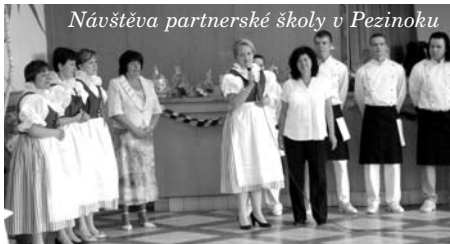
Návštěva partnerské školy v Pezínoku

Své působení na škole se v prvních červnových dnech pokoušeli úspěšně završit i žáci učebních oborů kadeřník a kuchař-číšník, kteří skládali závěrečné zkoušky. Ani těm se nevyhnula určitá inovace, protože se naše škola v letošním školním roce zapojila do Nové závěrečné zkoušky národního projektu MŠMT spolufinancovaného Evropským sociálním fondem a rozpočtem ČR. Tato zkouška organizovaná Národním ústavem pro odborné vzdělávání spočívá, podobně jako státní maturita, ve společném zadání – stejná náročnost by měla zajistit lepší srovnatelnost škol i žáků a také větší důvěru zaměstnavatelů k výučním listům.