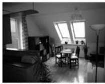
Novostavba DB 3+kk, Dlouhá, Tišnov CP 71 m 2 , nová KL, vest. spotřebiče, skříně. 1,690.000 Kč