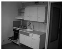
Byt OV 1+1 Tišnov ul. Králova, CP 36 m 2 , klidné místo, 3.patro 769.000,- Kč