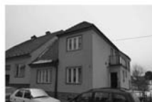
RD 5+kk Chudčice, CP 1007 m 2 , klidné místo, vl. studna, po část. rekonstrukci. 3,650.000,- Kč