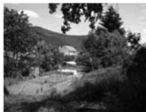
Stavební pozemek, Předklášteří, CP 854 m 2 , el., plyn i voda na hranici . 900 Kč / m 2