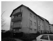
DB 3+kk Tišnov, ul. Dlouhá, CP 73 m 2 , 2/4, novostavba z r. 2005. 1,550.000,- Kč