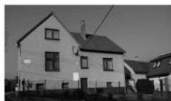
RD 5+kk, Předklášteří, Za Klásterem, CP 457 m 2 , dům po rekonstrukci, podsklepený, klidná lokalita, zahrádka,..... 3,695.000,- Kč