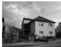
RD 8+2 Stěpánovice CP 1085 m 2 , dvougenerační, vl. studna. 3,500.000,- Kč