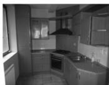
Byt 3 + kk v OV Tišnov, Květnická, CP 83 m 2 , 5 / 5 p., novostavba 1,799.000,- Kč