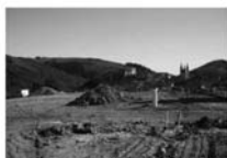
Prodej pozemku, Lomnice, CP 687 m 2 , ke stavbě samost. RD. 412.200 Kč