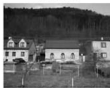
RD 2+1 (5+1) Tišnov, Trmačov dům se započ. rozšířením, CP 424 m 2 . Cena 1,999.000,- Kč