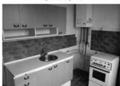
Byt 2+1 v OV, Tišnov, Homická, 2. p., 55 m 2 , chla, samost, plyn, kotel. 1,190.000,- Kč