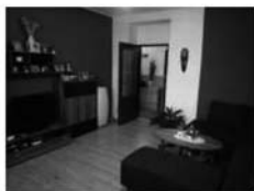
Byt 3+1 v OV, Lomnice, Družstevní 2.NP, CP 69 m 2 , s balkonem, v ceně i garáž. 1,540.000,- Kč