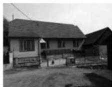
RD 3+1, Horní Loučky CP 323 m 2 , dvorek, stodola, plyn. přípojka. 790.000,- Kč