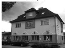
Pronájem obchodních prostor, Tišnov, Brněnská, možno až 73 m 2 , 1.p. Cena dohodou