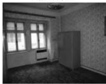
Byt 1+1 v OV, Lomnice, J. Uhra přízemí, CP 43,6 m 2 , k bytu dílna, zahrádka. 375.000,- Kč