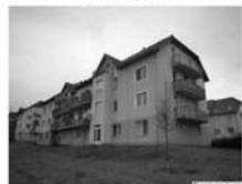
DB 3+kk Tišnov, ul. Dlouhá, CP 73 m 2 , 2/4, novostavba z r. 2005. 1.699.000,- Kč