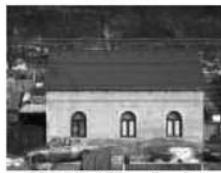
RD 2+1 (5+1) Tišnov, Trmačov dům se započ. rozšířením, CP 424 m 2 . Cena 1.999.000,- Kč