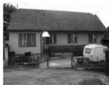
RD 3+1, Horní Loučky CP 323 m 2 , dvorek, stodola, plyn. přípojka. 790.000,- Kč