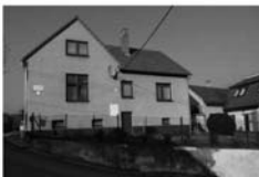
RD 5+ kk Předklášteří, klidná ulice, CP 457 m 2 , po rekonstrukci. 3.695.000,- Kč