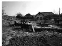
Stavební pozemek, Tišnov, CP 515 m 2 , cca 23 x 23 m. Jižní orientace, v zástavbě 799.000,- Kč