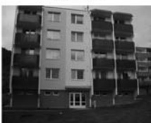
DB 1+1 Tišnov, ul. Květnická CP 33 m 2 , ložnice, anuita splacena. 800.000,- Kč