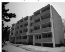
Byt 1+1 v OV, Tišnov, Králova, 2. p., 36 m 2 , dům po revitalizaci. 850.000,- Kč