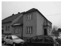
RD 5+kk Chudčice, CP 1007 m 2 , klidné místo, vl. studna, po část. rekonstrukci. 3.650.000,- Kč