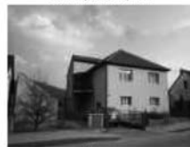
RD 8+2 Štěpánovice CP 1085 m 2 , dvougenerační, vl. studna. 3.500.000,- Kč