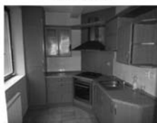
Byt 3+kk v OV Tišnov, Květnická, CP 83 m 2 , 5/5 p., novostavba 1.799.000,- Kč