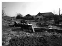
Stavební pozemek, Tišnov, CP 515 m 2 , cca 23 x 23 m. Jižní orientace, v zástavbě RD 875.500,- Kč