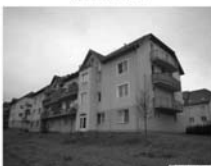
DB 3+kk Tišnov, ul. Dlouhá, CP 73 m 2 , 2/4, novostavba z r. 2005. 1,699.000,- Kč