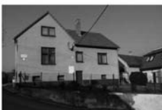
RD 5+ kk Předklášteří, klidná ulice, 457 m 2 , po rekonstrukci 3,745.000,- Kč