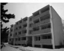
Byt 1+1 v OV, Tišnov, Králova, 2. p., 36 m 2 , dům po revitalizaci. 850.000,- Kč