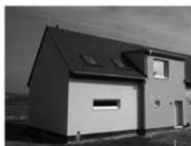
Radové RD Drásov, CP 300 m 2 , garáž, zahrada, velmi klidné místo, 2,999.000,- Kč