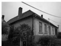
RD 3+1 Křižínkov CP 1.052 m 2 , k rekonstrukci Cena 1,350.000,- Kč