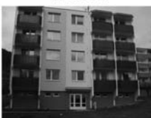
DB 1+1 Tišnov, ul. Květnická CP 33 m 2 , lodžie, jižní orient., anuita splacena. 800.000,- Kč