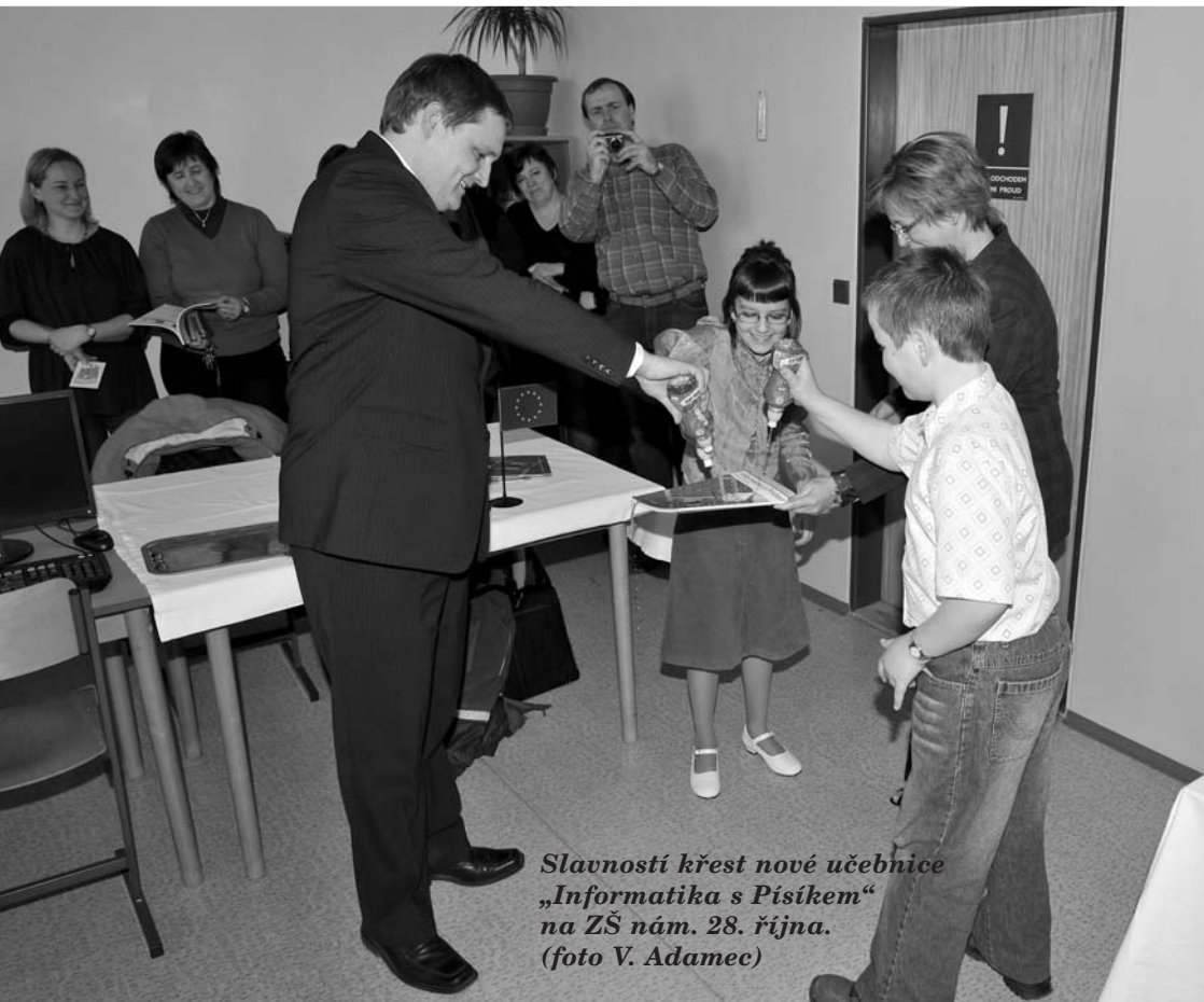
Slavností křest nové učebnice „Informatika s Pisíkem“ na ZŠ nám. 28. října.