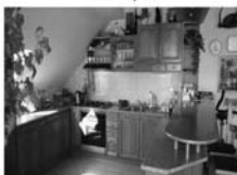
Pronájem 3+ kk, ul. Brněnská, novostavba, CP 140 m 2 , bezproblémové parkování 11.500,- Kč/ měsíc včetně inkasa