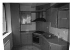
Pronájem 3+ kk Tišnov, Květnická, CP 83 m 2 , 5/5 p., novostavba 11.000,- Kč / měsíc včetně inkasa