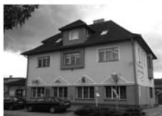
Pronájem obchodních prostor, Tišnov, Brněnská, možno až 73 m 2 , 1.p. Cena dohodou