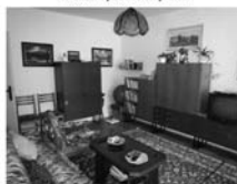
OV 3+1 Tišnov, ul. Halasova 1/7, parkety, CP 73 m 2 . 1,470.000,- Kč