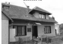
Prodej RD 4+kk, Pernštejnské Jestřabí CP pozemku 154 m 2 , lokální vytápění 450.000,- Kč