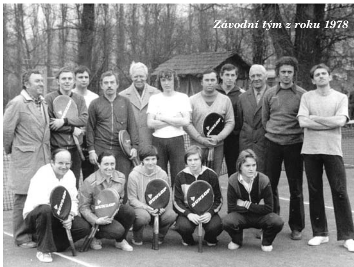
Závodní tým z roku 1978