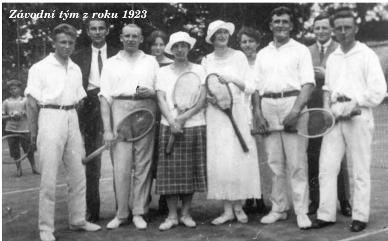
Závodní tým z roku 1923