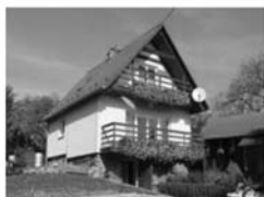
RD 3,5+1, Veselí u Lomnice U Tišnova zahradra, garáž s dílnou, JV orientace Cena v RK