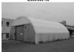
Pronájem skladové haly, Tišnov Rozměry 12 x 14 m, výška stropu 6m 350 Kč / m 2 / rok