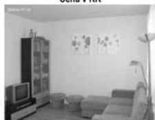
Byt 3+kk v OV, Tišnov, Formáňkova novostavba, CP 75 m 2 + balkon, 2.NP 2,099.000 Kč