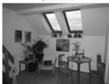
3+kk v OV, Tišnov, Květnická CP 83 m 2 , 4. patro, vl. plyn. kotel 1,490.000 Kč