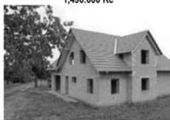
HS RD 6+1, Stěchov, ZP 150 m 2 , CP pozemku 1600 m 2 , garáž, zahrada 1,599.000 Kč