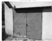
Pronájem garáže, Družstevní, Tišnov CP 18 m 2 , volně ihned 800,- Kč / měsíc

Komenského nám. 124, 666 01 Tišnov, budova Komerční banky, Tišnov, 1.patro, Tel. / fax: 549 410 321, mobil: 776 077 842, office@komplexnireality.cz