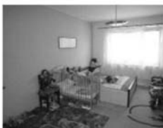
Byt 2+kk v OV, Kuřim, Školní cihla, CP 53 m 2 , 3.patro, 3 sklepy 1,349.000 Kč