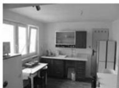
RD 4+kk, Strachotín CP 661 m 2 , řadový RD, zahrada 850.000,- Kč