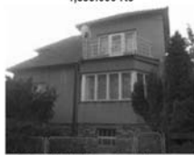
RD 4+1 Olešnice, okr. Blansko CP 757 m 2 , dílna, zahrada, sklep 1,799.000,- Kč