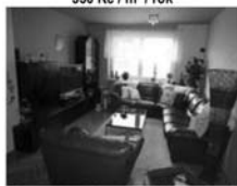
RD 1+1, 3+1 Předklášteří, CP 284 m 2 zahradka, garáž, posezení s krbem, ... 3,600.000,- Kč