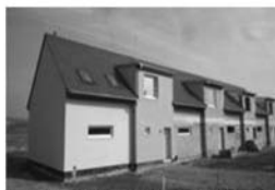
Řadový RD 5+kk, Drásov, CP 300 m 2 Kompletně dokončená stavba pouze bez KL 2,999.000 Kč