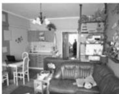
Byt 2+kk v OV, Kuřim, Školní cihla, CP 53 m 2 , 3.patro, 3 sklepy 1,349.000 Kč