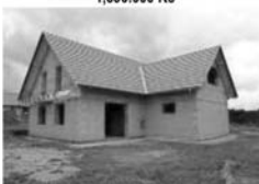
HS RD 6+1, Stěchov, ZP 150 m 2 , CP pozemku 1600 m 2 , garáž, zahrada 1,599.000 Kč