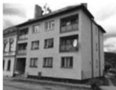
Byt 2+1, ul. Černoorská, Tišnov zvýšené přízemí, CP 57 m 2 , vl. plyn. kotel 1,110.000 Kč