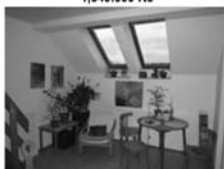
3+kk v OV, Tišnov, Květnická CP 83 m 2 , 4. patro, vl. plyn. kotel 1,590.000 Kč