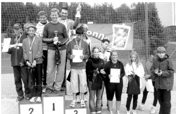
Na fotografii vítězové skokanského trojboje s putovním pohárem i pohárem pro vítěze ročníku 2012.