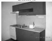
Pronájem 1+1, Tišnov, Osvobození. 1. patro, CP 36 m 2 , byt po rekonstrukci 7.500 Kč / měsíc včetně inkasa