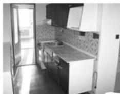
Byt 3+1 Tišnov, ul. Hornická 4.NP, CP 72 m 2 , před rekonstrukcí 1,440.000,- Kč