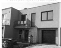
RD 1+1, 3+1 Předklášteří, CP 284 m 2 zahrádka, garáž, posezení s krbem, ... 3,600.000,- Kč