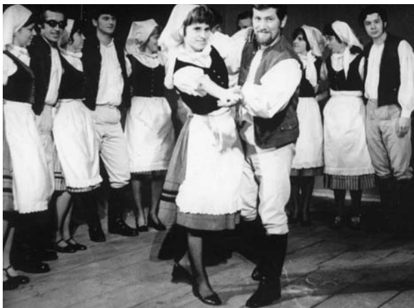
Besének při vystoupení