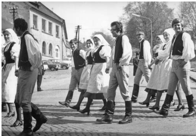
Besének v prvomájovém průvodu, za ním kus zmizelého Tišnova

Pojednání o folkloru by se mělo zaměřit i na kroj, písně, tance, složení muziky, ale to by měl být úkol pro odborníka, na to jsem si netroufnul.