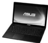
ASUS X55A-SX082V notebook