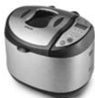
Pekárna chleba Sencor SBR 930SS