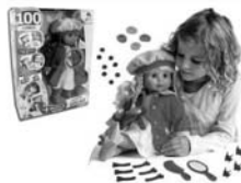
Panenka Adélka 100 funkcí