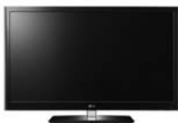
LG 42LW5500 3D LED FULL HD