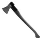
Ochsenkopf sekera Universal ROTBAND-PLUS