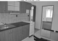
2+1, Kuřim, nám. Osvobození zvyš. přízemí, CP 56 m 2 9.000,- Kč/měsíc/včetně inkasa