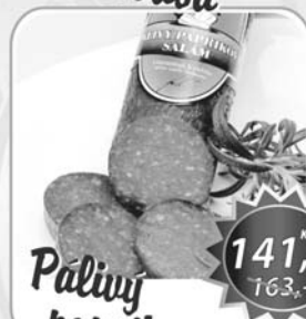
Pálivý paprikový salám