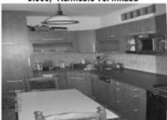
Pronájem 2+kk, Tišnov ul. Horova CP 53 m 2 , po rekonstrukci 9.000,- Kč/měsíc včetně inkasa