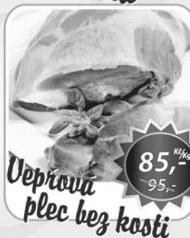
Uepřouř plec bez kosti