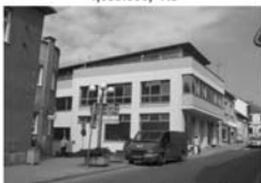
Pronájem Tišnov, ul. Brněnská CP 38 m 2 , luxusní s terasou 12 m 2 , 9.500,- Kč/měsíc vč. inkasa