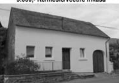
RD 3+kk, Rohozec CP 483 m 2 , plastová okna, nová kuch. linka 1.500.000,- Kč