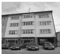
Pronájem 3+1, ul. Jungmannova 3.patro, CP 97 m 2 , nová kuch. linka, 10.000,- Kč/měsíc včetně inkasa