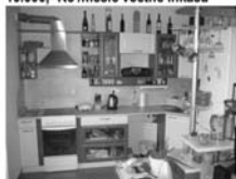
Pronájem 2+kk, Tišnov ul. Dlouhá, CP 68 m 2 , 9.000,- Kč/měsíc včetně inkasa