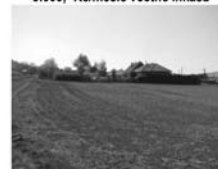
St. pozemek Čebín CP 1042 m 2 , rozměry 25 x 36 m 1.190,- Kč/m 2 /vč. provize