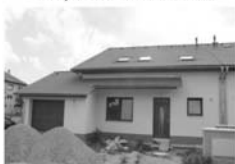
Novostavba 5+kk Dolní Loučky CP 806 m 2 , garáž + dílna, nízkoenergetický 3.990.000,- Kč