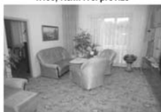
Pronájem 3+1, Předklášteří, ul. Uhrova CP 96 m 2 , garáž + zahrádka 7.000,- Kč/měsíc/bez inkasa