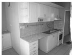
Byt 3+1 Tišnov, ul. Halasova 4.NP, CP 73 m 2 , po rekonstrukci, 1.499.000,- Kč