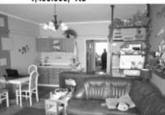
Prodej byt OV 2+kk, Kuřim, ul. Školní 3.patro, CP 53 m 2 , dubové parkety 1.349.000,- Kč