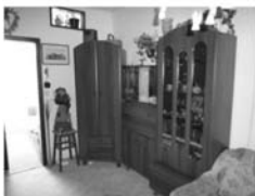
Byt 2+1, Tišnov, ul. U Humpolky CP 56 m 2 , 3.patro, družstevní byt 1.099.000,- Kč