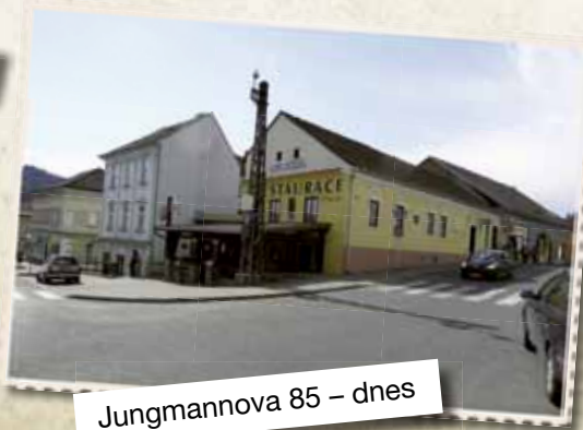
Jungmannova 85 – dnes