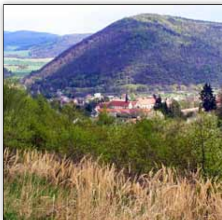
Výhled od Lesního klubu

Nebo zkuste náš Facebook Lesní rodinný klub na Tišnovsku.