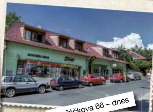
Dvořáčkova 66 – dnes