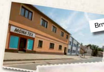
Brněnská 9 – dnes