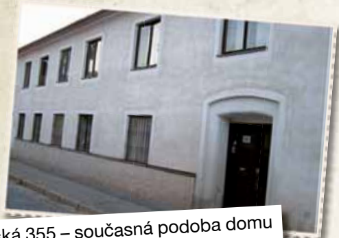
Klášterská 355 – současná podoba domu

1 Tišnov, Klášterská 355 Leopold Östereicher (1894–1944)