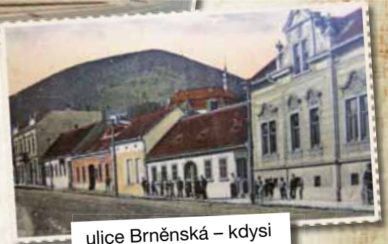
ulice Brněnská – kdysi