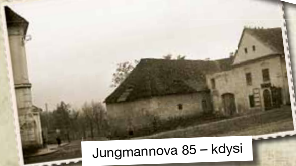
Jungmannova 85 – kdysi