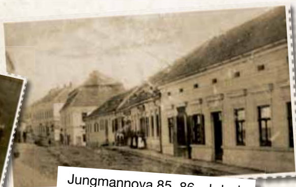
Jungmannova 85, 86 – kdysi