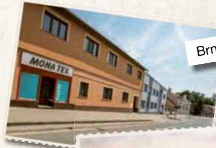
Brněnská 9 – dnes