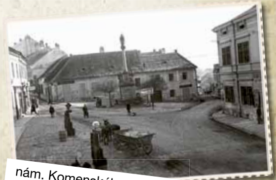
nám. Komenského – kdysi