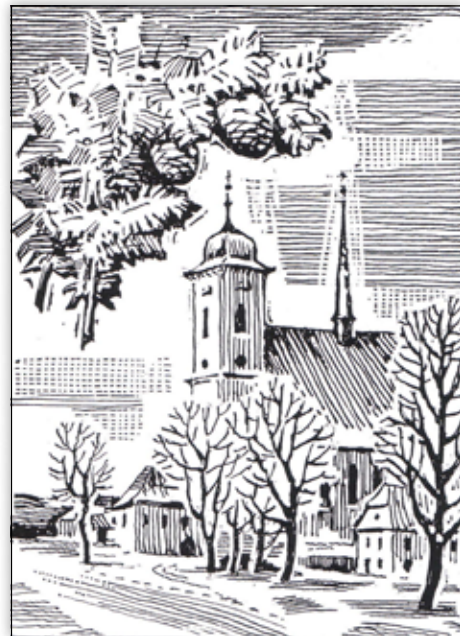
Stanislav Bělík: Doubravnický kostel (grafika)

V Bělíkově tvorbě mají zastoupení zátiší, především ta květinová, a květiny, které má rád pro jejich tvarovou a barevnou krásu a snad také proto, že