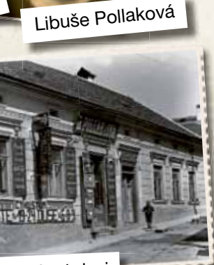
va 66 – kdysi