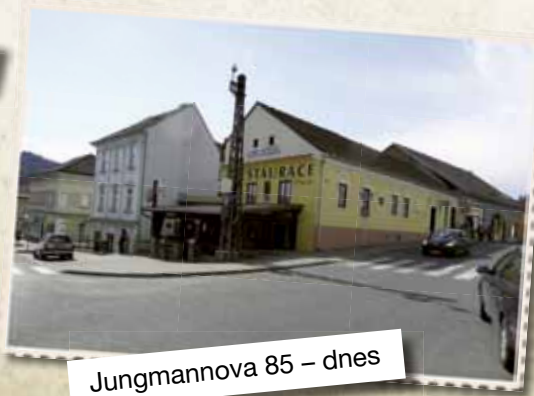
Jungmannova 85 – dnes