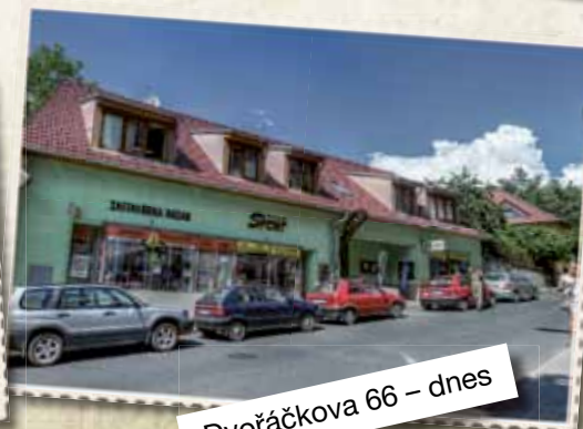
Dvořáčkova 66 – dnes