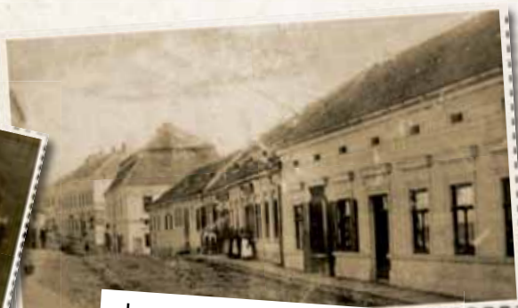
Jungmannova 85, 86 – kdysi