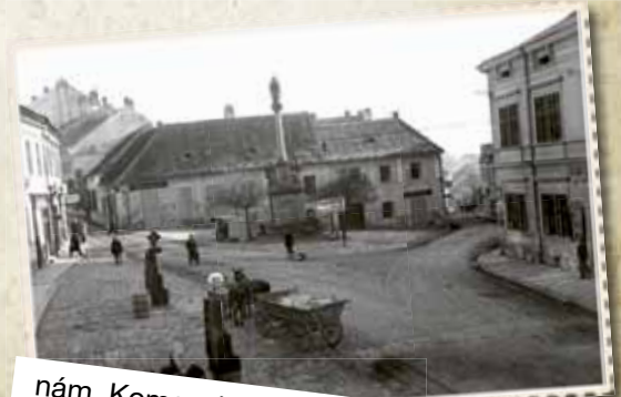
nám. Komenského – kdysi