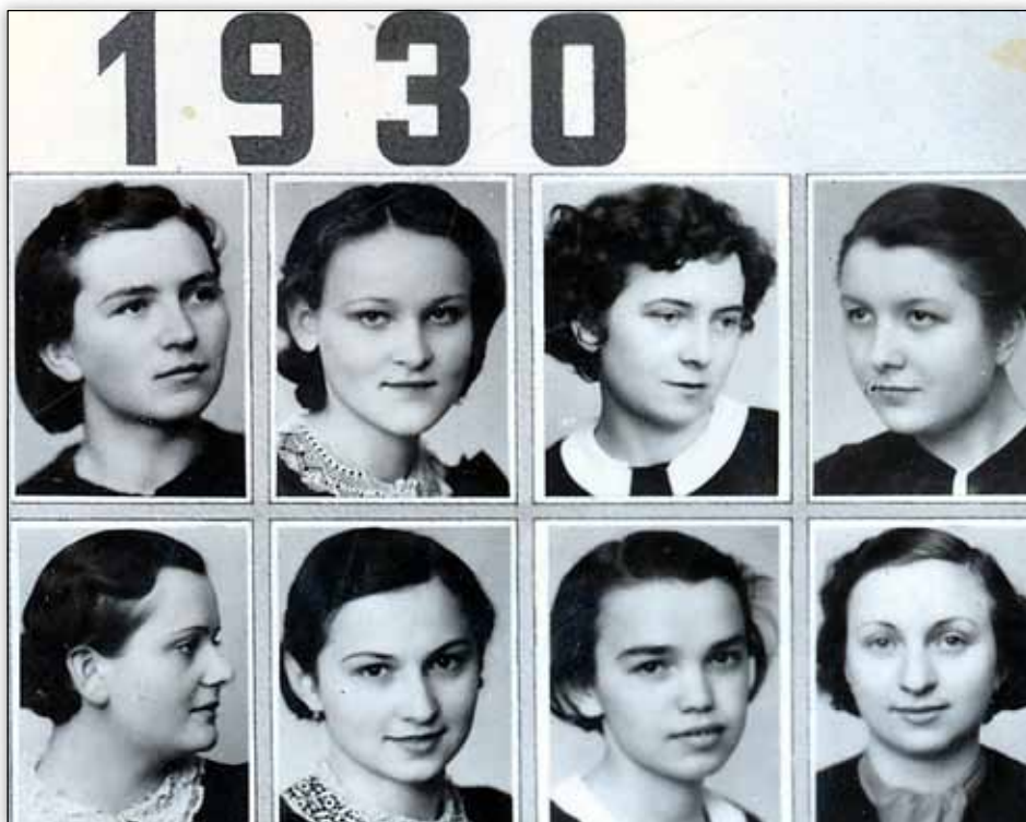
Výřez z maturitního tabla abiturientů tišnovského gymnázia z roku 1938, B. Č. třetí zleva

Přesné jméno protagonistky příběhu není uvedeno záměrně (pozn. aut.).