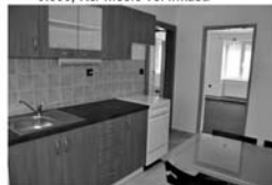
2+1, Kuřim, nám. Osвобоzení zvýš. přízemí, CP 56 m 2 9.000,- Kč/měsíc včetně inkasa