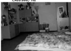
Pronájem 3+1, Tišnov, ul. Králova 1. podlaží, výměra 73 m 2 9.500,- Kč/ měsíc vč. inkasa