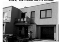
RD 5+2 Předklášteří garáž, pergola s krbem, bazén. 3.800.000,- Kč