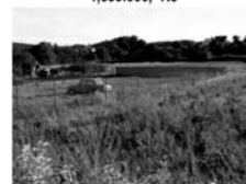
St. Pozemek Březina u Tišnova CP 1357 m 2 , u asf. komunikace vč. IS 799,- Kč/m 2