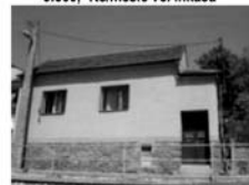
RD 3+1 Hradčany u Tišnova možno i s nájemníky, pozemek 501 m 2 1.399.000,- Kč