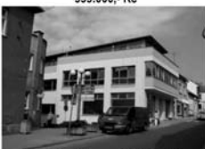
Pronájem Tišnov, ul. Brněnská CP 38 m 2 , luxusní s terasou 12 m 2 , 9.500,- Kč/měsíc vč. inkasa