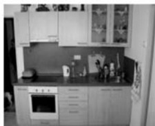
Byt 1+1 Tišnov, ul. Dlouhá novostavba, přízemí, CP 43 m 2 , 899.000,- Kč