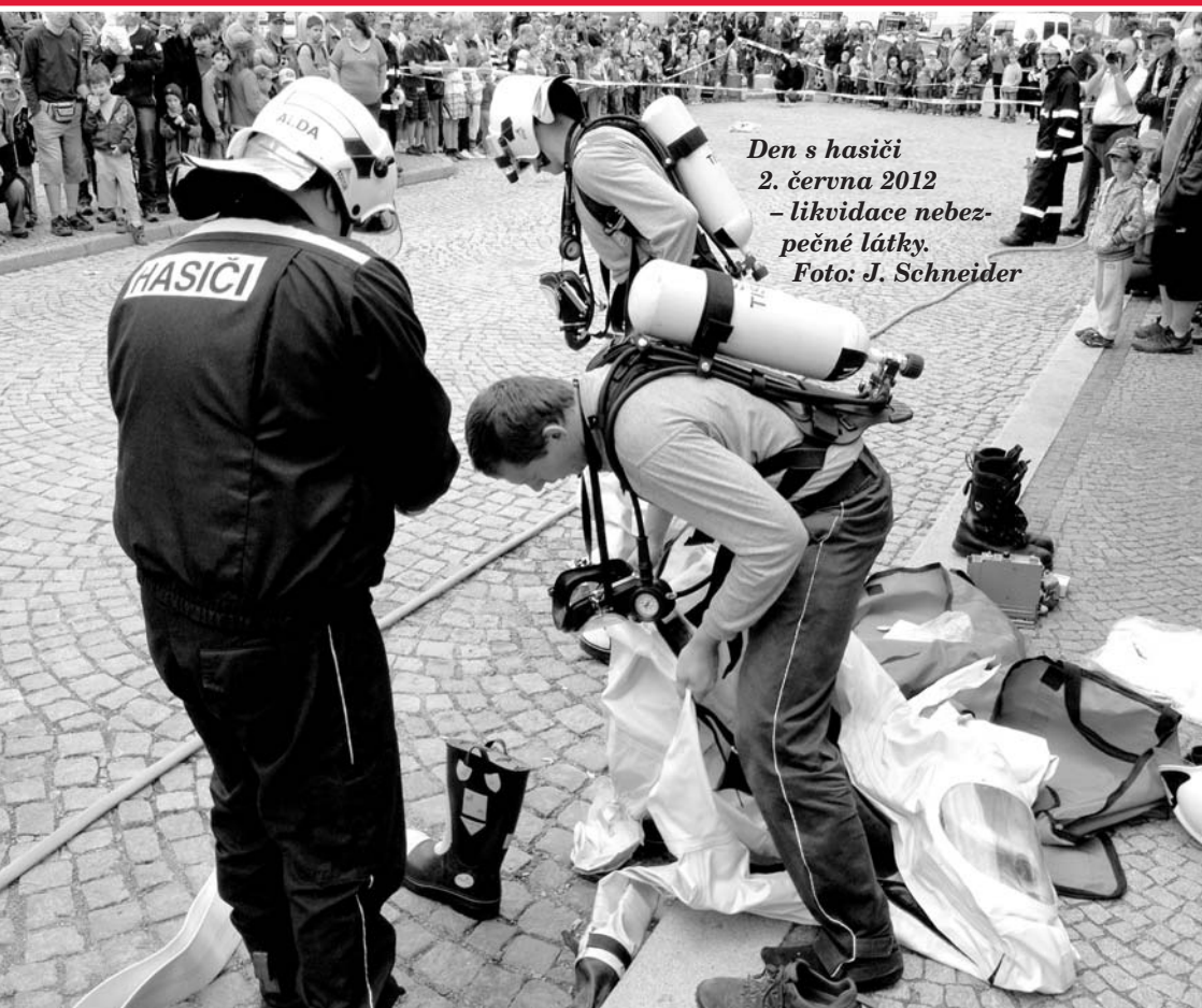
Den s hasiči 2. června 2012 – likvidace nebezpečné látky.