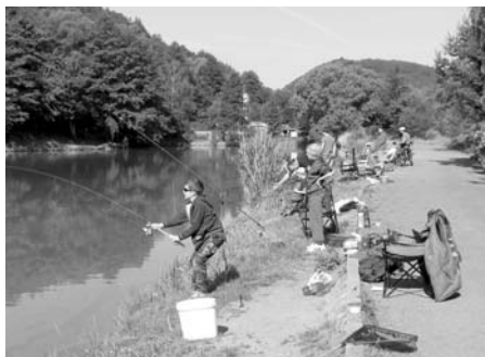
Závod v plném proudu

Všichni závodníci, nejen ti nejlepší, byli odměněni hodnotnými cenami,