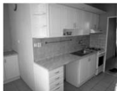
Byt 3+1 Tišnov, ul. Halasova 4.NP, CP 73 m 2 , po rekonstrukci, 1.499.000,- Kč