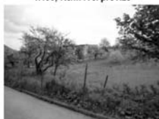
Stavební pozemek Předklášteří CP 1640 m 2 , IS v dosahu 1.000,- Kč/ m 2