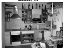
Pronájem 2+kk, Tišnov ul. Dlouhá, CP 68 m 2 , 9.000,- Kč/měsíc včetně inkasa