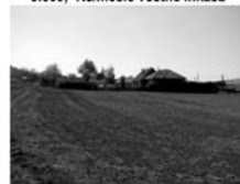
St. pozemek Čebín CP 1042 m 2 , rozměry 25 x 36 m 1.190,- Kč/m 2 vč. provize