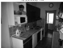
Byt 3+1, Tišnov, Halasova CP 75 m 2 , 6.podlaží,po rekonstrukci 1,450.000,-Kč