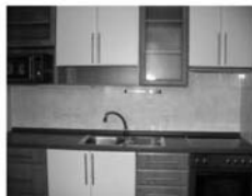
Byt 1+1 Tišnov, ul. K Čimperku 1.podlaží, CP 37 m 2 , novostavba, 999.000,- Kč