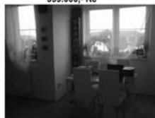
Byt 1+kk Tišnov, ul. Dlouhá 2. podlaží, balkon 4 m 2 , novostavba, 999.000,- Kč