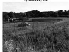
St. Pozemek Březina u Tišnova CP 1357 m 2 , obdelníkový tvar 999.000,-Kč