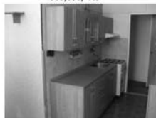
Pronájem 1+1, Tišnov, ul. Králova 4. patro, po rekonstrukci, CP 32 m 2 7.000,- Kč/měsíc/včetně inkasa