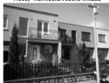
RD 5+2 Předklášteří Lomnička garáž, pergola s krbem, bazén, 3,800.000,-Kč