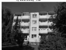
Pronájem 3+1, Tišnov, ul. Králova CP 73 m 2 , 1. Podlaží,, 9.500,- Kč/měsíc/včetně inkasa