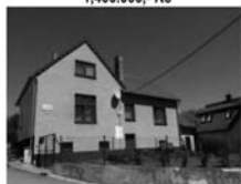
RD 5+kk Předklášteří CP 457 m 2 , po luxus. rekonstrukci 3,345.000,-Kč