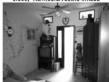
Byt 2+1 Tišnov, ul. U Humpolky CP 56 m 2 , ložnice, 2. patro 1,150.000,-Kč