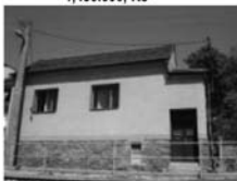
RD 3+1 Hradčany u Tišnova možno i s nájemníky, pozemek 501 m 2 1,400.000,- Kč