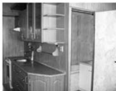
Byt OV 3+1 Tišnov, ul. Květnická CP 75 m 2 , 3. patro, nová KL i koupelna, 1,499.000,- Kč