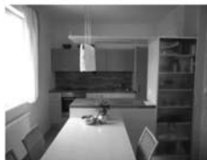
Byt 3+kk Tišnov, ul. Formánkova novostavba, přízemí, CP 62 m 2 , 1, 599.000,- Kč