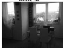
Byt 1+kk Tišnov, ul. Dlouhá 2. podlaží, balkon 4 m 2 , novostavba, 999.000,- Kč