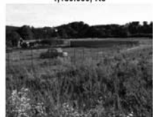
St. Pozemek Březina u Tišnova CP 1357 m 2 , obdelníkový tvar 999.000,-Kč