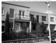
RD 5+2 Předklášteří Lomnička garáž, pergola s krbem, bažen. 3,800.000,-Kč