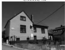
RD 5+kk Předklášteří CP 457 m 2 , po luxus. rekonstrukci 3,345.000,-Kč