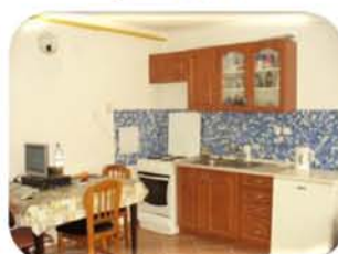
Pronájem bytu 2+kk, Tišnov CP 45 m 2 , plastová okna, 7.000,- Kč/měsíc