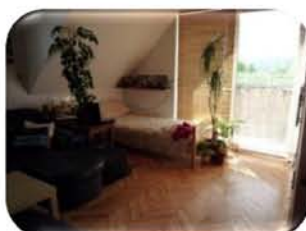
Pronájem bytu v RD 4+kk, Hradčany CP 73 m 2 , zahrádka, sklep, dílna 10.000,- Kč/měsíc