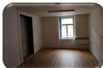
Pronájem komerčních prostor ul. Radniční, CP 75 m 2 , skladovací prostory ... 3.700,- Kč/+ inkaso/měsíc