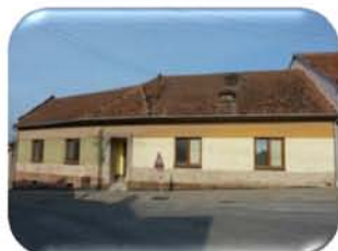
Prodej RD 6+1 v obci Čebín, CP pozemku 730 m 2 , po část. rekonstrukci 2,500.000,- Kč