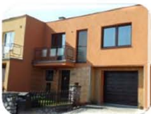
RD 4+2, Předklášteří garáž s dílnou, zahrada Cena po slevě: 2,999.000,- Kč