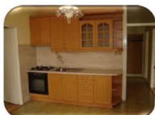
Byt 3+1 v OV +3 zaskl. balkony, Tišnov CP 72 m 2 , 3. patro, výtah, 1,750.000,- Kč