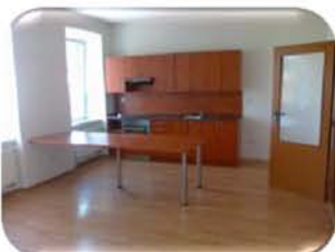
Pronájem bytu 4+kk, Lomnice CP 100 m 2 , po rekonstrukci 7.500,- Kč/+ inkaso/ měsíc

Tradice, jistota, profesionalita již 10 let s vámi.