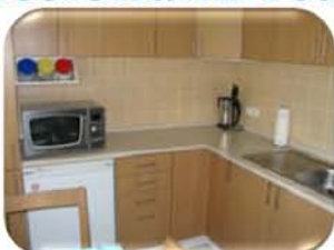
Byt 2+1 v OV se zaskl.lodžii,Tišnov, CP 56 m 2 1.NP, po celkové rekonstrukci, 1,390.000,- Kč