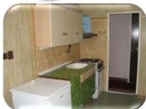
Byt 1+1 v OV, ul. Králova, Tišnov, 1.NP, CP 37 m 2 , sklep 2 m 2 950.000,- Kč