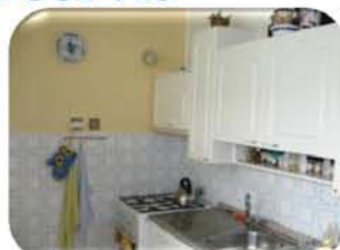
Byt 2+1 v OV se zaskl. lodžii, Tišnov CP 56 m 2 , 3. patro, dům po celkové rekonstrukci 1,300.000,- Kč