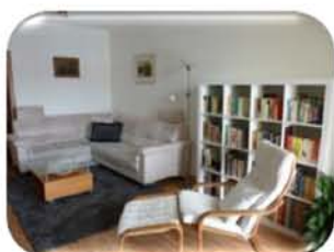
Prodej bytu 3+kk v OV, Tišnov CP 78 m 2 , 3.NP, nízké měsíční náklady 2,150.000,- Kč