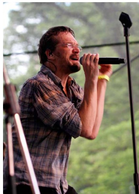
Dan Bárta okouznil tišnovské publikum

I v letošním roce měl festival především charitativní přínos. Pořadatelé za vydatného přispění diváků rozdělili mezi více charitativních projektů celkovou částku 100 000 Kč, podpořili činnost občanského sdružení TAP dětí z Jedličkova ústavu, projekt opravy skautského domu v Tišnově a samozřejmě také očkovací program UNICEF, což je také hlavním posláním tohoto netradičního festivalu, který si po pěti letech své existence už našel své pevné místo na festivalové mapě republiky. Hudební festival Hudbou pro UNICEF byl i v letošním roce akreditován v projektu Čistý festival a pro rok 2013 také obdržel certifikát, který potvrzuje, že se pořadatelé a návštěvníci chovají po celou dobu festivalu ohleduplně k životnímu prostředí.