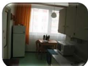
Pronájem bytu 3+1, Tišnov, CP 72 m 2 , volně ihned 9.500,- Kč / měsíc