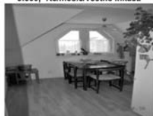
Byt OV 3+1 Tišnov, ul. Dlouhá CP 75 m 2 + 6 m 2 , lodžie, 4. patro 1.850.000,-Kč