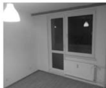
Pronájem 1+1 Tišnov, ul. Květnická 2. patro, CP 33 m 2 , po rekonstrukci, 7.500,- Kč/měsíc/včetně inkasa