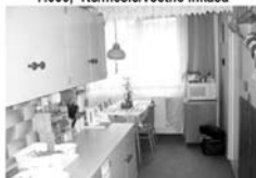
Pronájem 3+1, Tišnov, ul. Králova CP 73 m 2 , 1. patro, 9.500,- Kč/měsíc/včetně inkasa