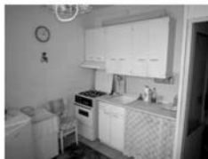
Pronájem 1+1 Tišnov, ul. Halasova 5.patro, CP 32 m 2 , 7.000,- Kč/měsíc/včetně inkasa