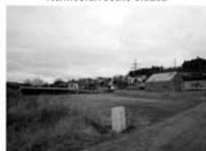
Stavební pozemek Hradčany u Tišnova Sluneční ul., CP 1657 m 2 , obdelnikový tvar 2.400.000,-Kč