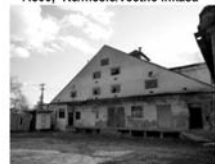
Prodej objektu bývalé sýpky Tišnov CP 2.612 m 2 , inž. síťe, oploceno 4.500.000,- Kč k jednání