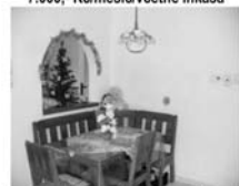
Pronájem 3+1, RD Lomnička CP 110 m 2 po rekonstrukci, zahrada 9.500,-Kč/měsíc/vč. inkasa