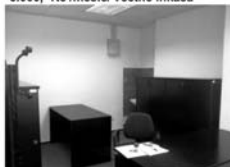
Pronájem kanceláře, Tišnov 2.patro, budova KB, CP 17 m 2 , 4.200,- Kč/měsíc/včetně služeb