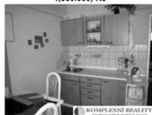
Byt OV 2+kk, Kuřim, ul. Školní CP 53 m 2 , 4.patro, po rekonstrukci 1.450.000,-Kč