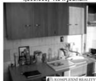
Byt 1+1, Tišnov, ul. U Humpolky 4. patro, po část. rekonstrukci, CP 32 m 2 7.000,- Kč/měsíc/včetně inkasa