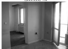
Pronájem 2+1, Tišnov, U Humpolky CP 64 m 2 , 5. patro s výťahem 8.000,- Kč /měsíc/ včetně inkasa