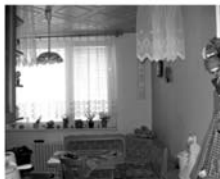
Byt OV 3+1 Tišnov, ul. Květnická CP 75 m 2 , 4. patro, po rekonstrukci, 1.550.000,- Kč