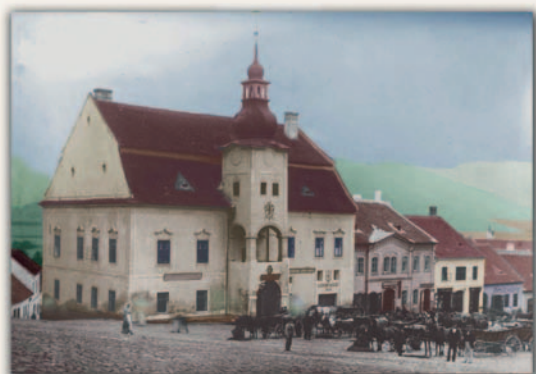
Fotoateliér Pavel Smékal Janáčkova 102, Tišnov

otevřeno 8. 6. - 16. 6. 2013 od 9 do 18 hodin