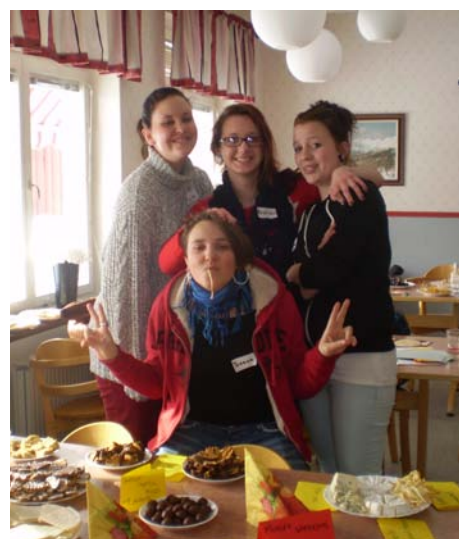
Global Village – prezentace potravin jednotlivých zemí

Na závěr bych chtěla říct, že ať už se člověk učí ve škole o gastronomii jakéhokoliv státu cokoli, je nejlepší, když to zažije na vlastní kůži, protože tak pozná nejlépe návyky, povahu a zvyklosti lidí. Já osobně jsem musela už pět dní po návratu vyjet do IKEI, abych si zde koupila ten kulatý, lehce chemický chleba, na který jsem si za ten týden zvykla, a abych si připomněla všechny dostupné chutě a vůně Švédska u nás.