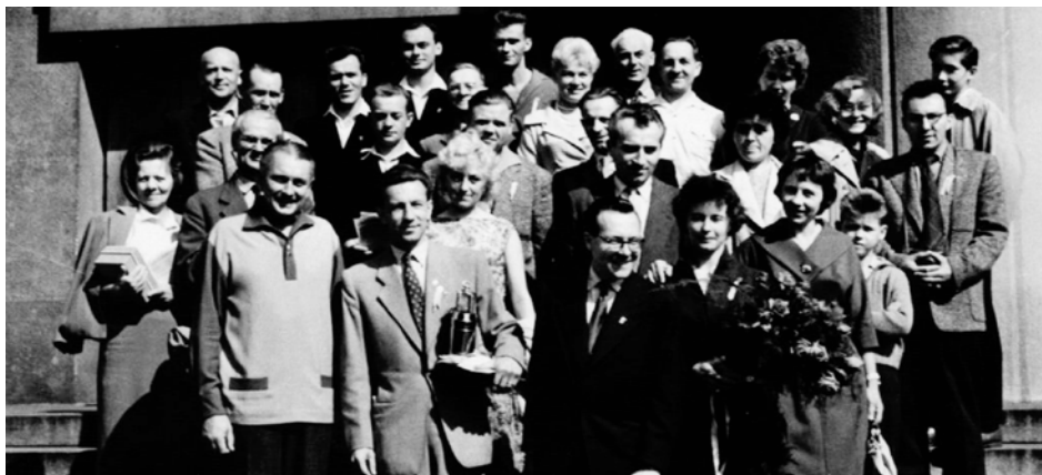
Soubor Karasova divadla - Jiráskův Hronov (1961)