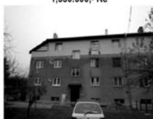
Rozpracovaný byt 5+kk Předklášteří CP 139 m 2 , cihlový dům s vlast. topením, 1.580.000,-Kč