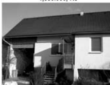
Rodinný dům 4+1 Horní Loučky Po rekonstrukci, s možností rozš. do podkroví, CP 386 m 2 , 2.499.000,-Kč