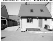
RD 5+kk Tišnov, Hony za Kukýrnou CP 530 m 2 , lux. Novostavba, bazén 4.800.000,-Kč k jednání