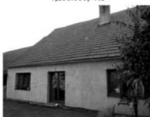
RD 4+1 Unín s garáží a stodolou CP 1337 m 2 , po rekonstrukci, 2.599.000,-Kč