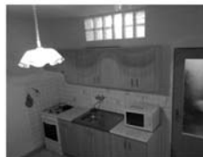
Pronájem 1+1 Tišnov, ul. Květnická 2. patro, CP 33 m 2 , po rekonstrukci, 7.500,-Kč/měsíc/včetně inkasa