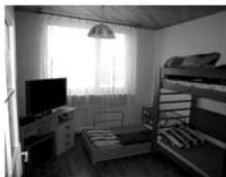
Byt OV 3+1 Tišnov, ul. Květnická CP 75 m 2 , 4. patro, po rekonstrukci, 1.550.000,- Kč