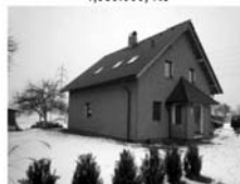
Rodinný dům 5+kk Svatoslav CP 500 m 2 , luxusní novostavba, 3.099.000,-Kč