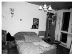
Byt OV 1+1 Tišnov, Osvobození CP 42 m 2 , po kompletní rekonstrukci, 987.000,-Kč