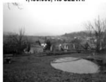
Stav. pozemek Hradčany S krásným výhledem na Tišnov, 1.600 m 2 , 1.200.000,- Kč