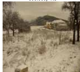
Stavební pozemek Tišnov CP 1446 m 2 , klidné místo 1 450,-Kč/m 2