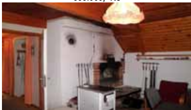
Prodej chaty ve Stříteži u Dolní Rožinky CP 236 m 2 , velikost 2+1, podsklepená 500.000,- Kč