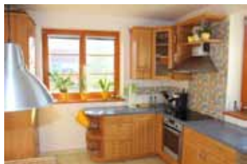
Novostavba RD 7+1, Drásov CP 934 m 2 , terasa, venkovní sauna, jezírko,... 6,600.000 Kč