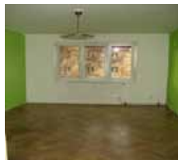
Byt 2+kk v OV, Kuřim, Školní CP 59 m 2 , cihla. 3. Patro, 4 sklepy 1,349.000 Kč