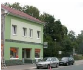
Pronájem obchodních prostor, Tišnov ul. Brněnská, CP 40 m 2 , soc. zařízení, 7.000,- Kč/ měsíc bez energie