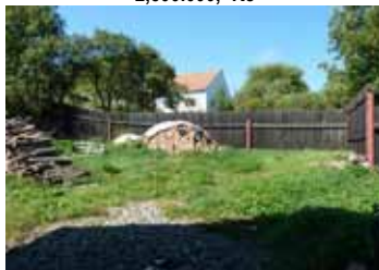
Stavební pozemek, Kuřimské Jestřabí CP 985 m 2 , IS na pozemku krom kanalizace 840.000,- Kč