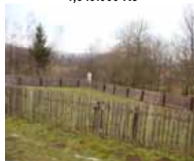
Stavební pozemek, Křižovice CP 659 m 2 , klidné místo 300.000,- Kč