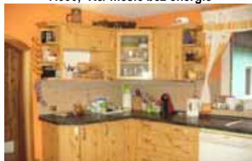
Prodej RD 4+1, Doubrovník CP 606 m 2 , zahrada 757 m 2 , po rekonstrukci, 2,500.000,- Kč