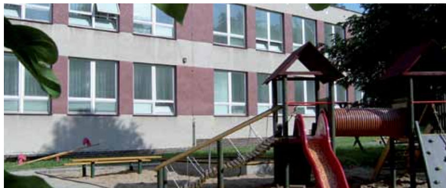
MŠ Sluníčko, Tišnov