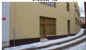
Pronájem obchodních prostor, ul. Brněnská CP 39 m 2 , volné od 1.2.2013 9.000,- Kč/ měsíc bez energie