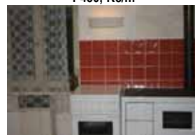
Pronájem bytu 1+1, Lomnice CP 46 m 2 , sklep, zahrada 4.300,- Kč/ měsíc bez energie