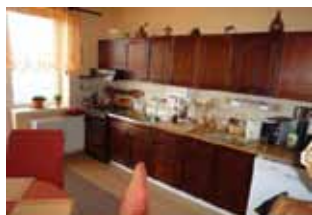
RD 5+2 Předklášteří, CP 284 m 2 zahrádka, garáž, bazén, venk. krb ... 3,400.000,- Kč