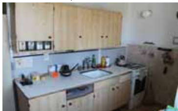
Prodej bytu 2+1, Tišnov, ul. Jamborova CP 53 m 2 , 1. patro, nový balkón, plast. okna 999.000,- Kč