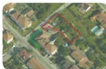
Staveb.pozemek, Tišnov, Družstevní CP 677 m 2 , k výstavbě samost. stoj. RD 1.600.000 Kč

Tradice, jistota, profesionalita již 10 let s vámi.