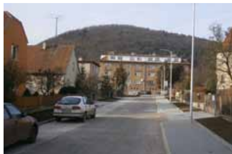
ulice Jiráskova po