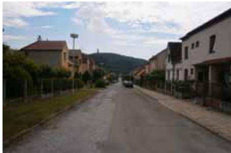
ulice Družstevní před

dokončeno a vzniklá nespokojenost z průběhu celé akce byla nahrazena spokojeností z nově zrekonstruovaných ulic.