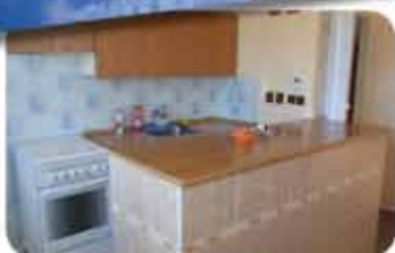
DB 3+1, Unín, 1. patro, CP 78 m 2 , plast. okna, vlast. kotel Sleva 1.000.000,- Kč

Děkujeme za projevenou důvěru a řešíme se na spolupráci v novém roce.