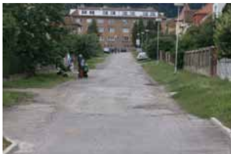
ulice Jiráskova před