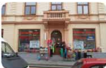
Pronájem komerčních prostor, Tišnov ul. Brněnská, CP 220m 2 , 30.000,- Kč/měsíc/bez inkasa