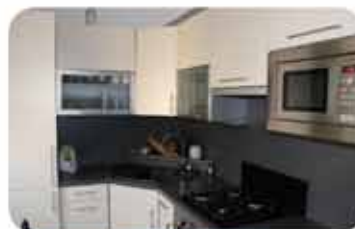
DB 2+1, Tišnov, Na Rybníčku, CP 58 m 2 , 2.patro, vlastní plyn. kotelna 1.490.000,- Kč