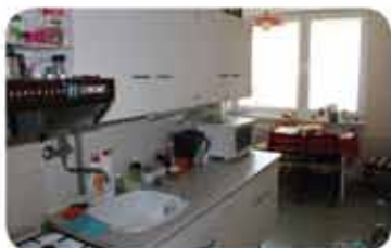
Byt OV 2+1, Tišnov, Mánesova 4. patro s výtahem, CP 55 m 2 , lodžie, 1.180.000,- Kč

KOMPLEXNÍ REALITY® profesionální realitní servis