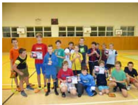
týmy kategorie B