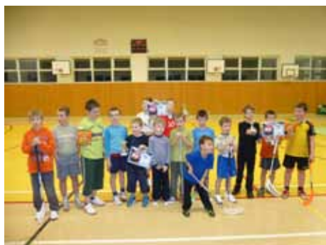
týmy kategorie A

Děkujeme všem, kdo si naše výrobky koupili, a děkujeme i dětem, které svými výrobky přispěly na dobrou věc.