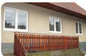
RD 3+1, Horní Loučky CP 323 m 2 , vytápění plyn i tuhá paliva 999.000,- Kč