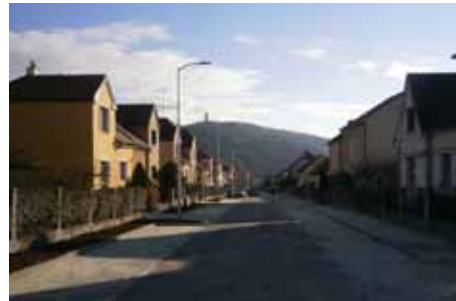
ulice Družstevní po