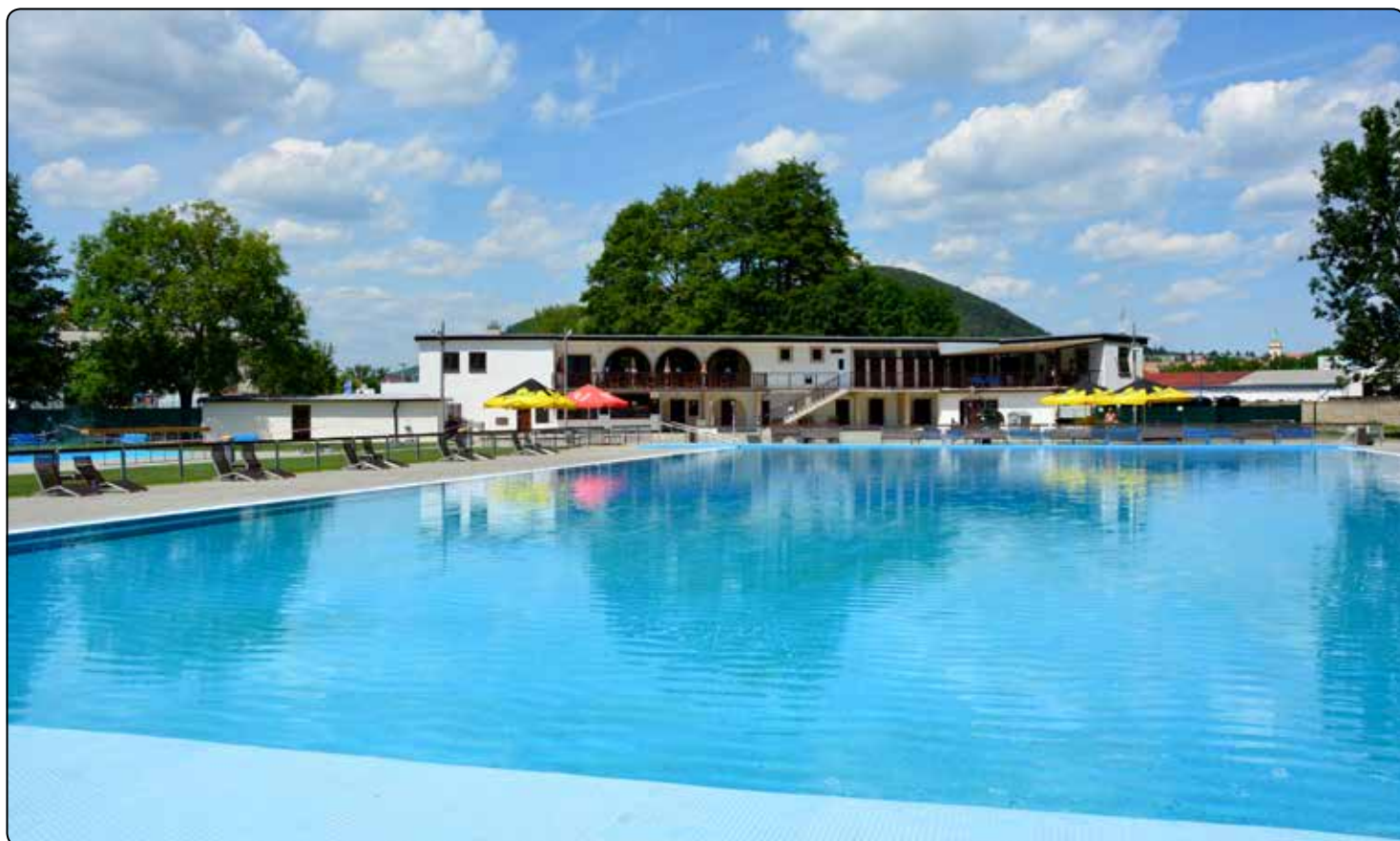
Zrekonstruované tišnovské koupaliště zahájilo provoz 17. června.

Přeji všem čtenářům příjemné letní dny, prázdniny plné zážitků a dobrou náladu.