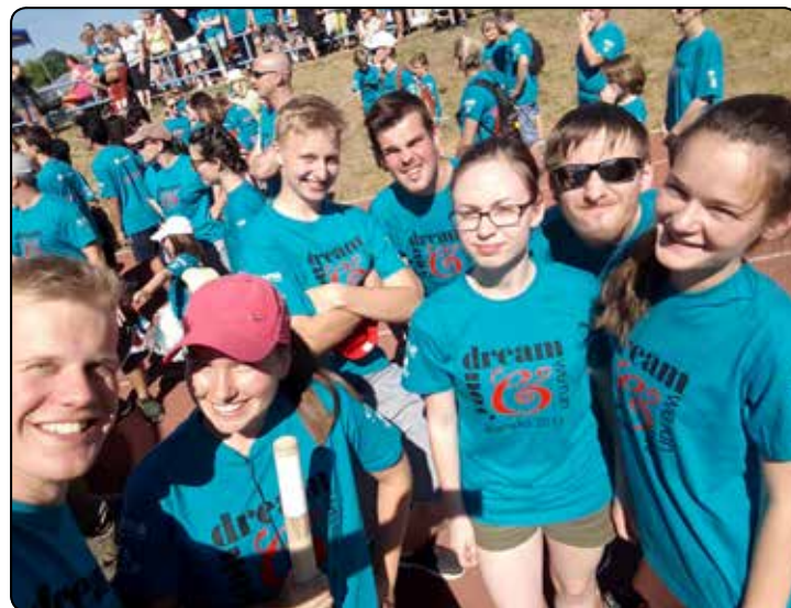
Část týmu FarTi.

9. až 10. června. Za účasti 54 štafet z širokého okolí, které měly jediný úkol, udržet v pohybu štafetový kolík po celých 24 hodin, se do této akce zapojily i dva týmy z Tišnova: Atletický klub Tišnov a FarTi, tým farnosti Tišnov. Oba uběhly cca 290 km, běžely ruku v ruce ve dne i v noci a společný hec a povzbuzování na trase taktéž vyjadřovaly myšlenku sounáležitosti. Počet závodníků FarTi týmu byl 25, v týmu „Atletů“ 32. Všem patří dík za podporu. Výkon obou štafet se lišil jen o dva kilometry a v pomyslném pořadí všech štafet obsadily 10. a 11. místo. Oba týmy tak dohromady přispěly k hlavnímu cíli částkou kolem cca 16 000 Kč. Celkově závod vydělal 330 000 Kč a pomohl tak splnit všech deset snů.