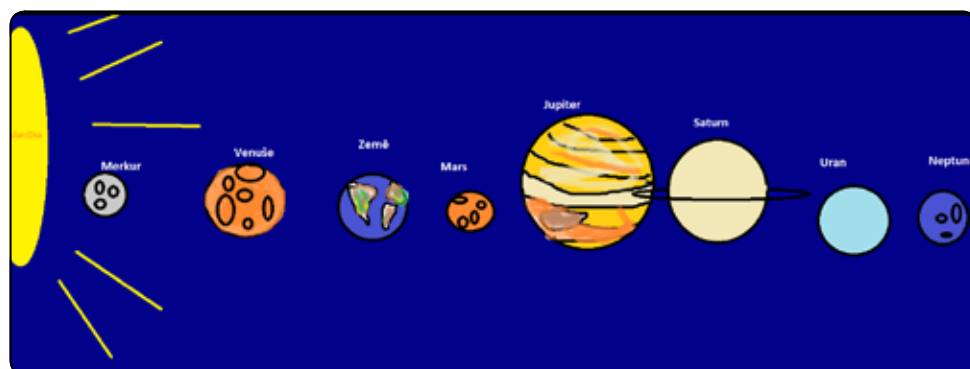
Ukázka z tvorby žáků 4. a 5. ročníku v programu Malování