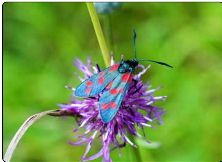
Vřetenušky mají výrazné výstražné zbarvení.

objevovat už koncem května, na sušších místech o měsíc později. Vajíčka jsou kladena v hromadných snůškách po 30 až 50 na spodní stranu listů živné rostliny, příležitostně i na květy. Dorostlé housenky se mohou vyskytovat již koncem dubna až do poloviny července.