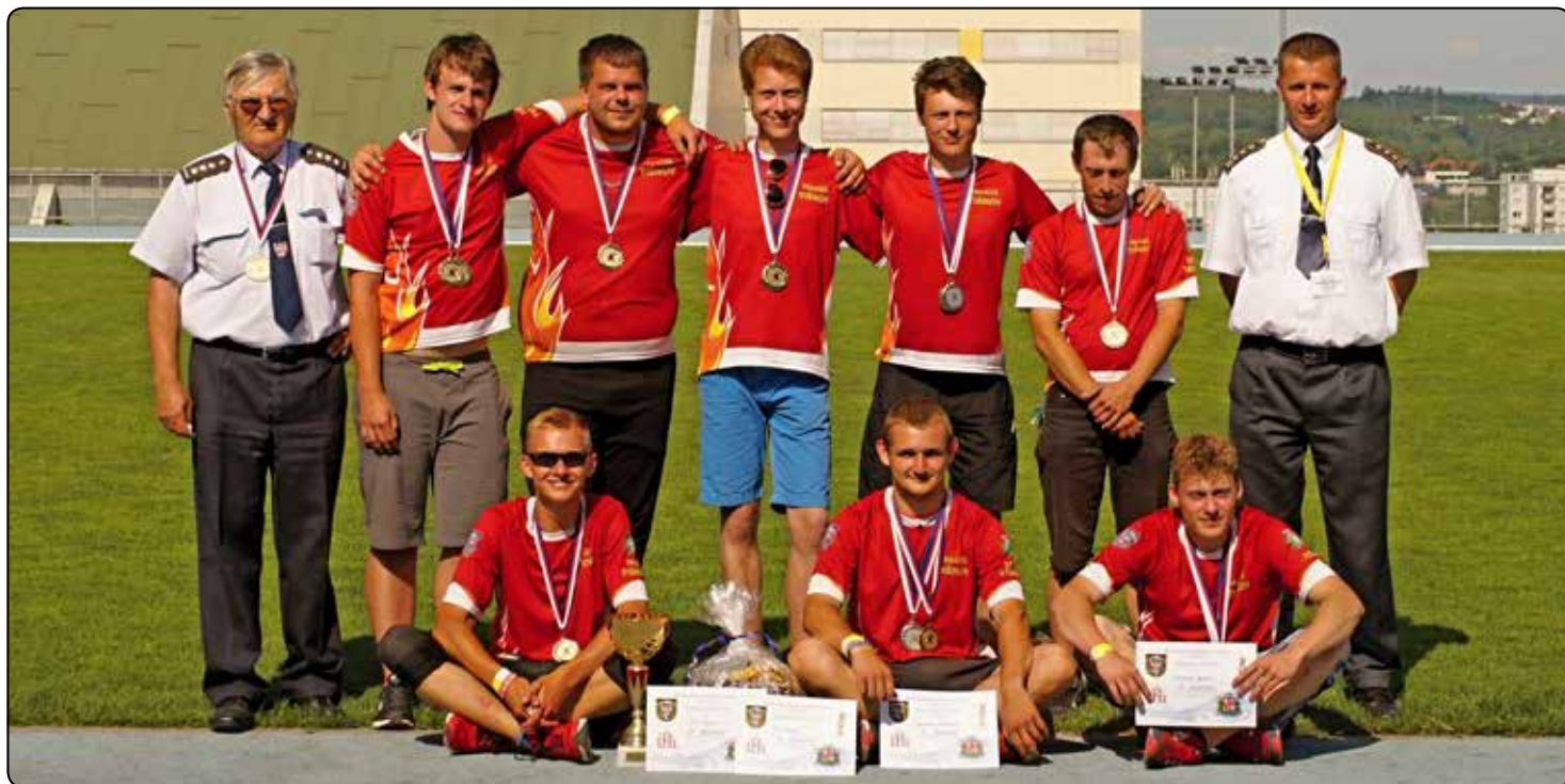
SDH Tišnov.

Za dobrovolné hasiče z Tišnova přeji krásné prožití prázdnin.