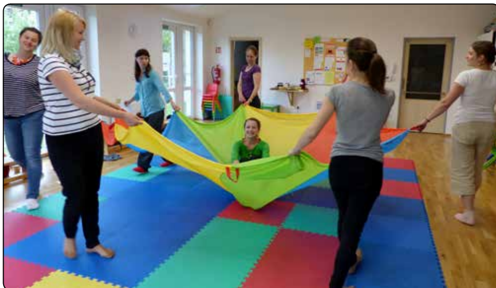
I maminky si rády hrají aneb Školení studánkových lektorek.

Na oslavě studánkových narozenin v září 2017 bude RC Studánka opět udělovat Řád dětského úsměvu. Jedná se o ocenění společností či organizací, které jsou přátelské rodinám s dětmi. Každý subjekt je hodnocen