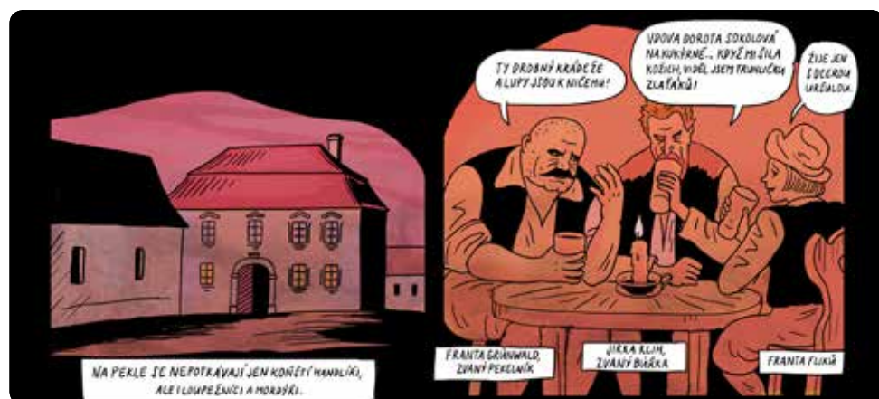
Autor obrázku: Marek Rubec

Posílat finanční příspěvky můžete i přímo na účet spolku Continuum vitae – č. ú. 107-5059170277/0100.