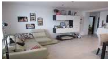
Prodej bytu 3+kk, Kuřim, Na Královkách, CP 65 m 2