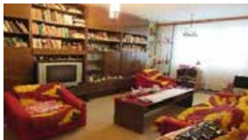
Prodej bytu 3+1 v OV, Tišnov, Květnická, CP 74 m 2