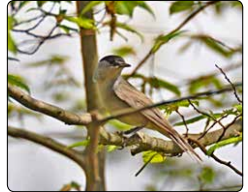
Samec pěnice černošlavé má na hlavě výraznou černou čepičku.

Věk pěnice černošlavé se odhaduje až na dvanáct let.