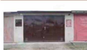
Prodej garáže na okraji Tišnova.Trnec CP 15 m 2