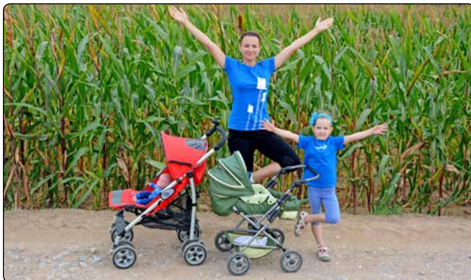
Na jaře opět začínáme cvičit s kočárky.

Workshop s Montessori tematikou, který proběhne v sobotu 22. dubna od 9.00 do 12.00, je zaměřen na to, jak naučit dítě sebeobsluže