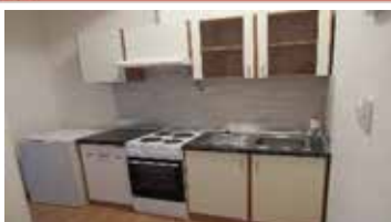
Pronájem bytu 1+1 v centru Tišnova. Junamannova CP 32 m 2