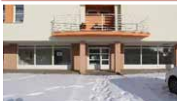
Pronájem nebytových prostor, Tišnov, Králova. CP 106 m 2