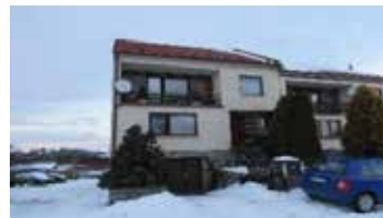
Prodej RD 6+kk s garáží, Deblín, pozemek 296 m 2