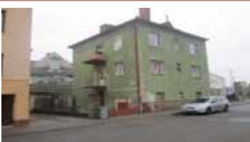
Prodej id.polooviny RD, Tišnov, Na Loukách, pozemek 385 m 2