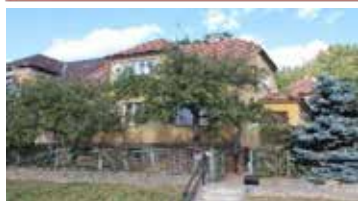
Prodej RD 6+1, Tišnov Těsnohládkova pozemek 679m 2