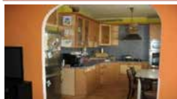
Pronájem bytu 3+kk, Tišnova, Hornická. CP 54 m 2